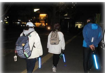
寒い中でもパトロール