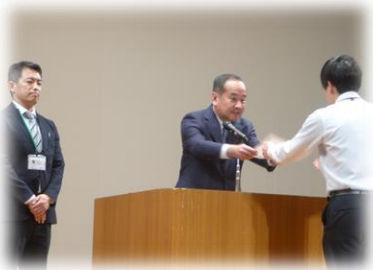
教育長より指導員へ委嘱状の授与