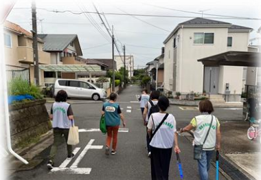
中学校区ごとのパトロール