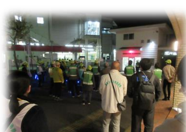
市防犯協議会との合同パトロールも行います