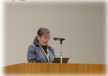
深津会長のあいさつ