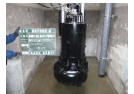
若松ポンプ設置状況