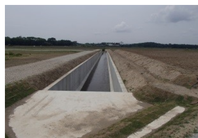
北新田堤外排水路

柴崎排水区の最下流となる北新田内の堤外排水路は、4号排水路との合流地点から約140mを平成26年3月末に完成しました。今年度は、更に上流の約240mを延ばす第2工区を8月に契約し、平成27年3月末に完成する予定です。