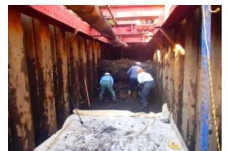
久寺家地区雨水管布設工事状況

今年度は、我孫子二階堂高校北側の雨水管布設工事を8月に契約し、平成27年3月末に完成する予定です。