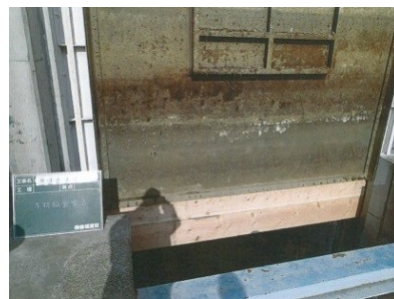
ゲート下部の継ぎ足し完成