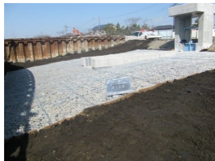
若松第5排水区樋管