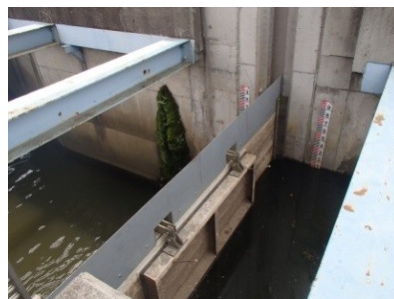
ゲート上部のかさ上げ完成

また、ポンプ1台を増加しましたので、ポンプの最大能力が毎分68m 3 から76m 3 になりました。