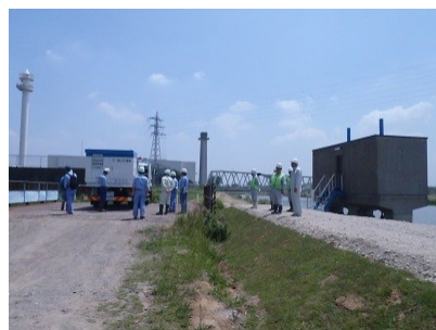
訓練状況(布佐樋管付近にて)

また、国の協力により昨年度より能力アップした(最大ポンプ能力毎分13m 3 から毎分30m 3 となる。)新しい排水ポンプ車を北千葉排水機場に常時配置しています。