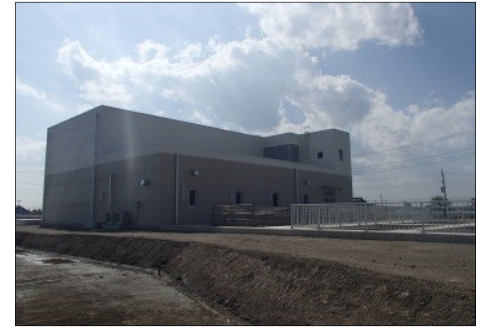
布佐ポンプ場外景

現在は、昨年度から2ヶ年継続事業である布佐ポンプ場(電気・機械)工事を行っており、平成26年9月に据付けし、平成27年2月末の供用開始を目指しています。