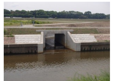
北新田4号排水路との合流地点