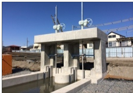
若松第3排水区樋管

若松地区の樋管築造やポンプ場は、平成23年度より着工し、我孫子高校側の若松第5排水区から第3排水区までの内水を手賀沼に排水する最終の出口となる樋管3箇所と内水を手賀沼に強制排水できるポンプ場3箇所が、平成26年3月末に完成しました。今までのポンプ場は、ゲートの開閉を含め手動でしたが、新しいポンプ場は、ゲートの開閉を含めポンプ運転を自動化することで、スムーズにポンプ運転に切り替えることができるようになりました。なお、6月の降雨の際、本運転し効果も確認しました。現在は、手賀沼公園側の若松第1排水区と第2排水区の樋管工事や若松第1ポンプ場の改修工事を行っており、平成26年11月末の完成を目指しています。