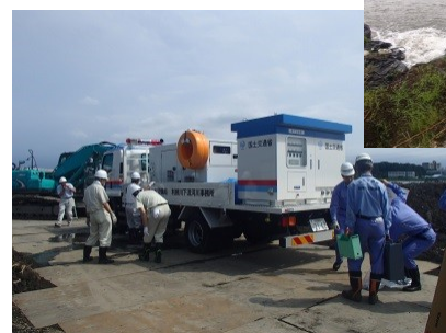
訓練状況(若松第1ポンプ場付近にて)