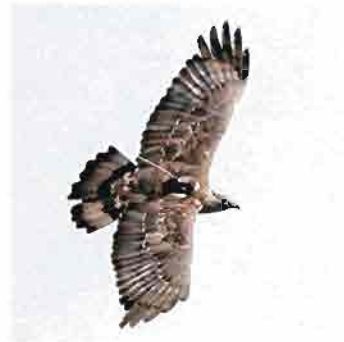
白樺峠上空を衛星送信機をつけて飛ぶハチクマ