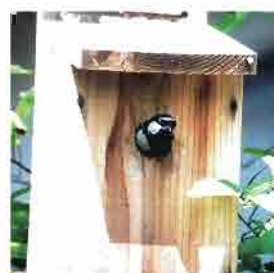
巣箱から顔をのぞかせるシジュウカラ