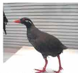
常設展に追加したヤンバルクイナ

8月のテーマトークは「ヤンバルクイナはなぜ飛ばない」でした。ヤンバルクイナの生態や新種発見までの話など盛りだくさんの内容でした。博物館では9月からヤンバルクイナの標本の展示を始めましたので、ぜひご覧ください(3階世界の鳥コーナー)。10月のテーマトークはニワトリの原種セキショクヤケイについてお話いただきます。