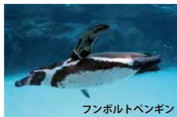
フンボルトペンギン

日本ではよく目にするフンボルトペンギンですが、野生では数が少なくなり、絶滅が心配されています。そのため、現在は野生の動植物の国際取引を規制するワシントン条約によって保護されています。