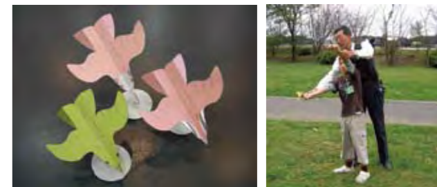
手投げで練習した後に、カタパルトで大空に飛ばします！