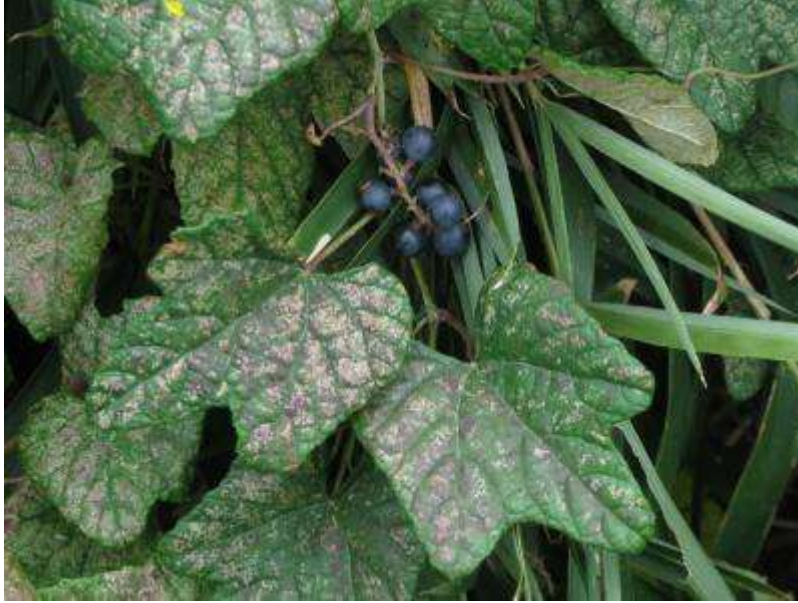
エビヅルも実りの季節。