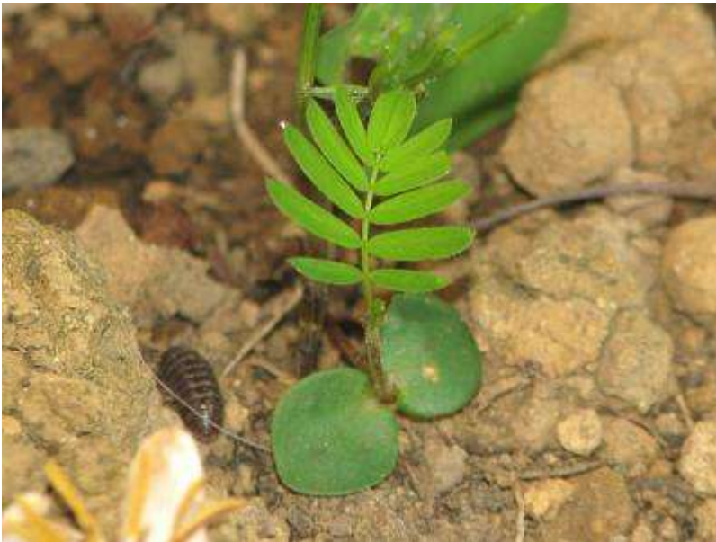
カワラケツメイがこぼれ種から発芽して本葉を出しました。