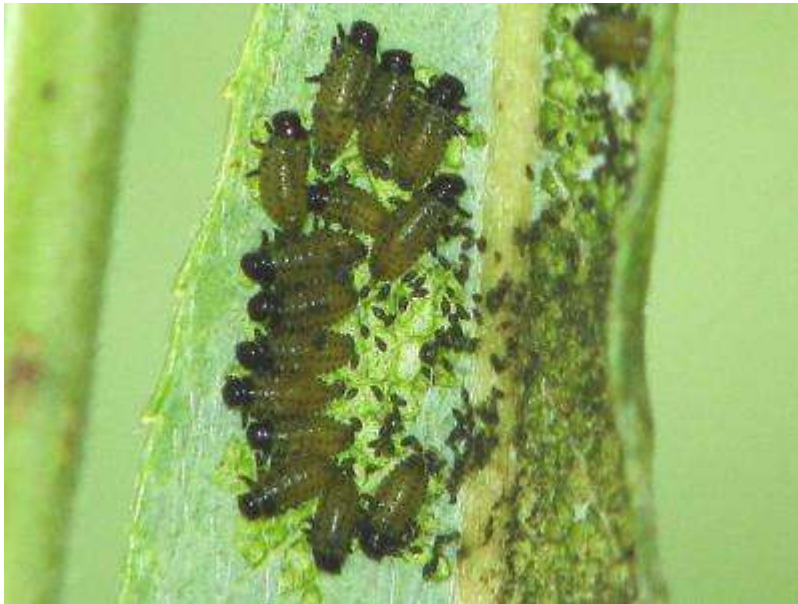
ヤナギリハムシの幼虫