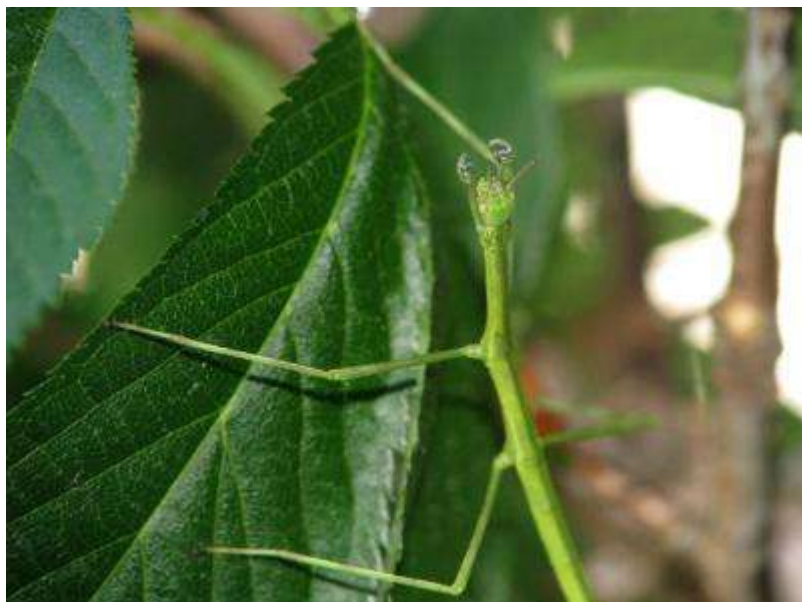
4月15日、さらに前肢が伸びているようですが、先の方はループ状になってしまいました。