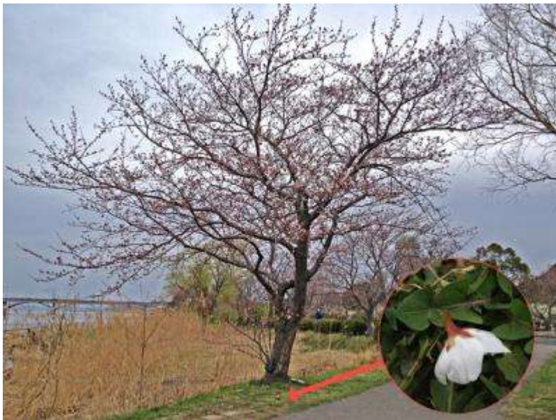
手賀沼遊歩道の‘ソメイヨシノ’は、沼縁のため、少し遅れて五分咲き程度。早速スズメがやってきて花をちぎって、蜜を失敬！最近ではよく知られる光景になりました。