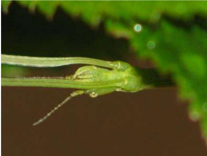
ナナフシモドキの口