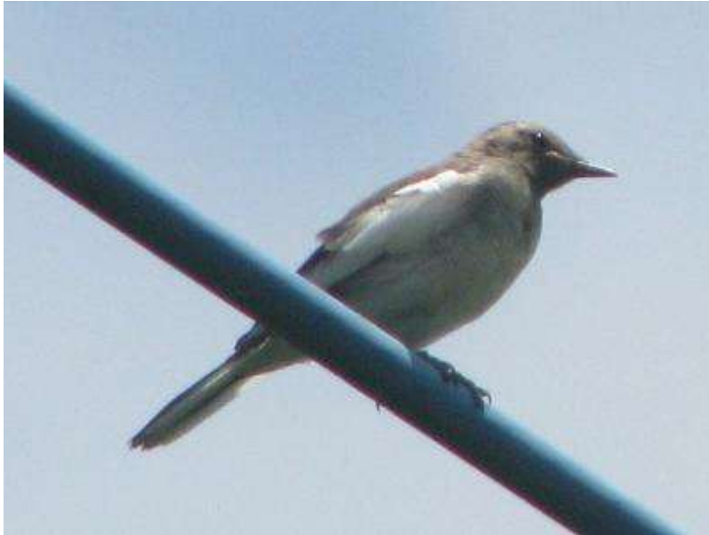
セグロセキレイ幼鳥