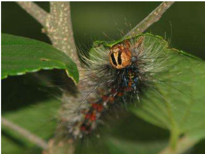
エノキの葉を食べるマイマイガの幼虫。