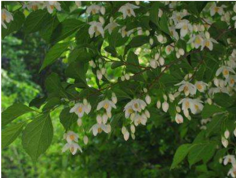
裏口のエゴノキの花が最盛期