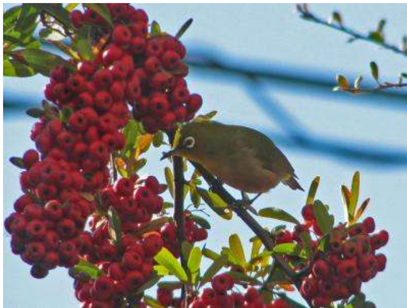
真っ先にやって来たメジロ

目立つ色の割には鳥に不人気のピラカンサ(トキワサンザシ)の果実。博物館事務室窓際の果実にも鳥が群がるようになりました。鳥にとってきびしい餌不足の時期のようです。どこの庭先の餌台もにぎわっていることでしょう。