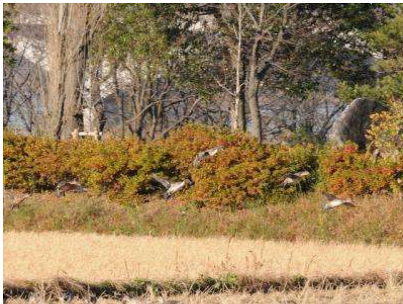
親水広場のほうから次々と飛んできました。

今朝、鳥の博物館前の水田に30羽ほどのオナガガモが降りていました。水田に落ちている籾（もみ）を食べているようです。先週末に、この田んぼでは二番穂（稲刈りの後に生えてくるイネに実る穂）の刈り取りが行われており、そこか