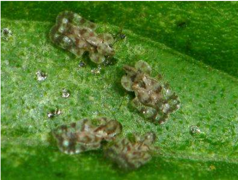
アワダチソウグンバイ（最近全国に広がっていると言われる北米原産のカメムシの仲間）