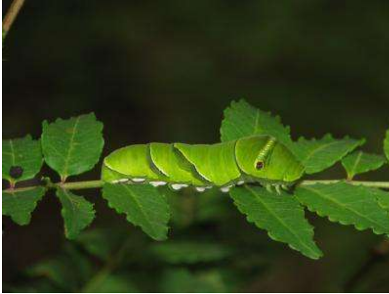
鳥の博物館裏庭のサンショウの葉上のアゲハ