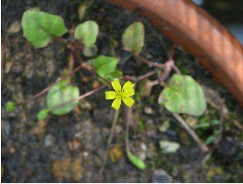
栽培中のコオニタビラコに花が咲く