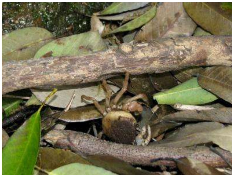
斜面林からの絞り水のある場所で、サワガニ発見。