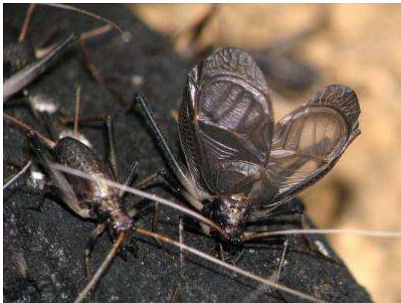
(鳴くオスと近づくメス)

5月26日の当ブログで孵化したことをお知らせしたスズムシが、鳴き始めました。孵化してから約2ヶ月を経て、成長したオスは鳴き、メスは卵を産み、確実に次世代へと「スズムシであること」が、引き継がれてゆきます。