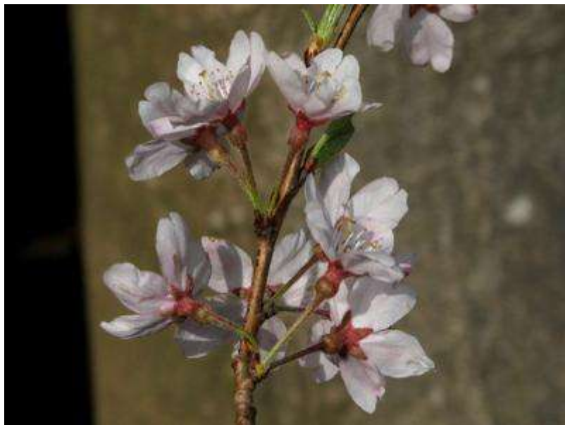
‘ソメイヨシノ’の母方のエドヒガンザクラ。