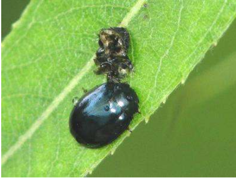
シダレヤナギの葉上のヤナギリハムシ