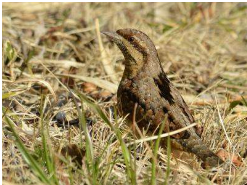
芝生で餌を採るアリスイ (2013.3.1,撮影:小笠原征紀氏)