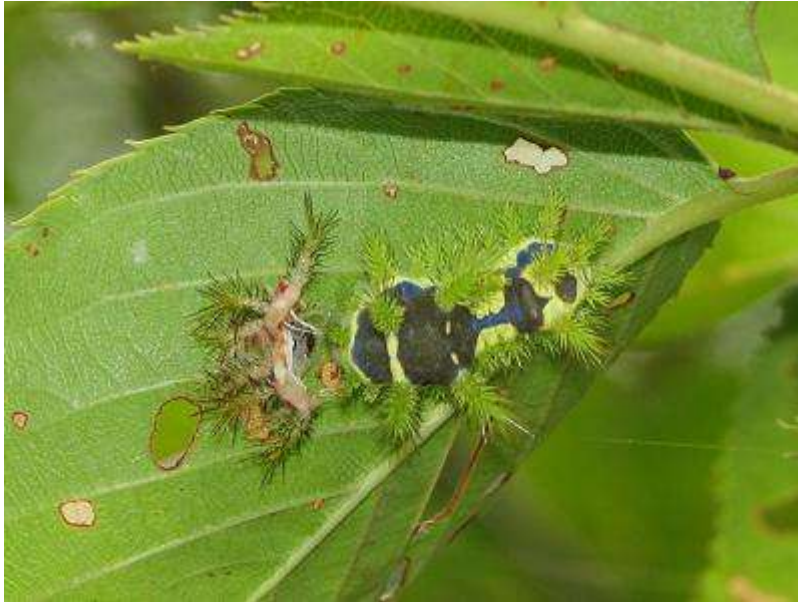
イラガの幼虫に注意！（毒トゲに触れると激痛が・・・）カップ噴水前のサクラの樹でたくさん見かけました