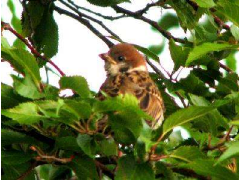
付近の巣立ち雛に時々給餌