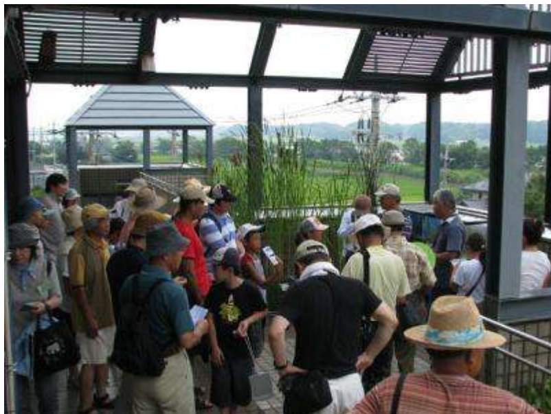
受付後、3階展望テラスに集合という新パターン