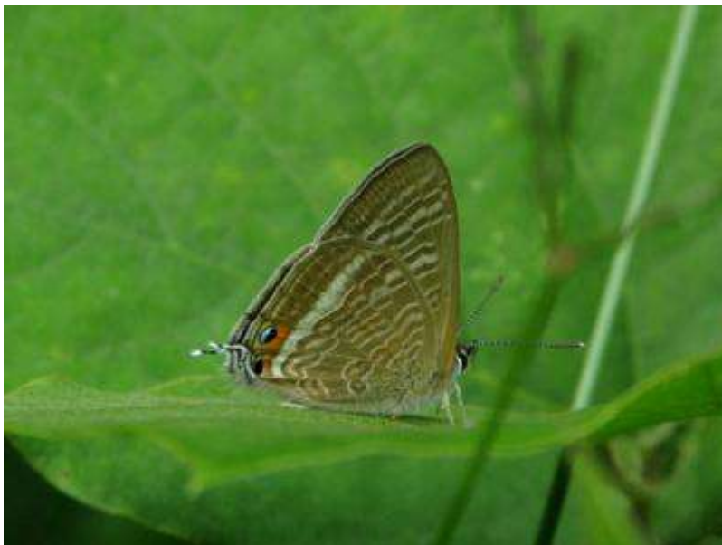
北上を続けるチョウ、ウラナミシジミがクズの群落内に多数乱舞していました。

October 7日Thursday: 「あびこ自然観察隊－利根川ゆうゆう公園でバッタ観察－」