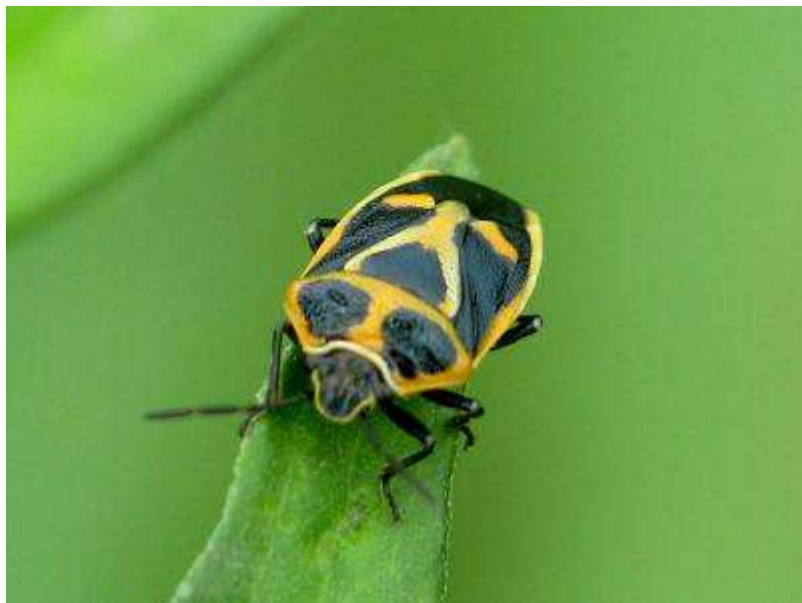
カメムシの仲間のナガメ