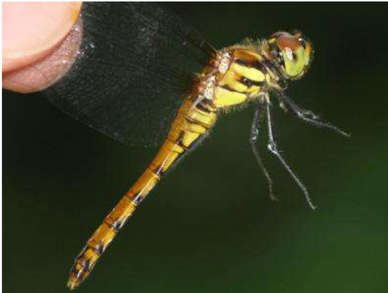
樹林内で見つけたナツアカネ