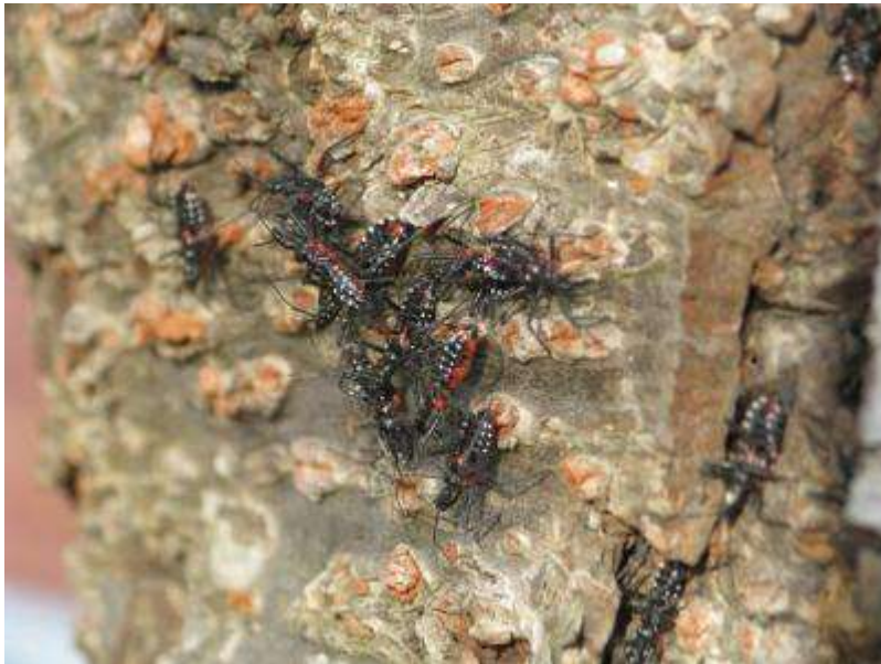
幹のすき間によく見かけるヨコヅナサシガメ。こも巻きは、絶好の越冬場所。