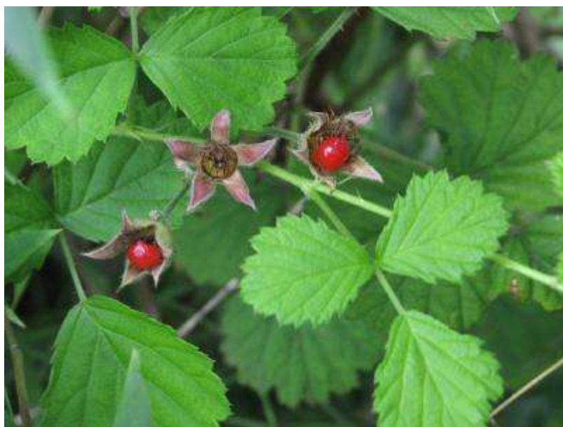
ナワシロイチゴの果実

半夏生（季節を表す七十二候の一つで毎年7月2日頃）のころに咲くから、あるいは半分化粧したように斑入りだから等が名前の由来とか。