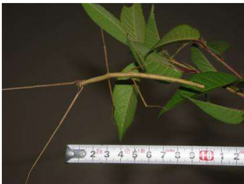
どんどん食べて、頭頂から腹部端まで約10センチメートルに成長したナナフシモドキ。産卵間近か？