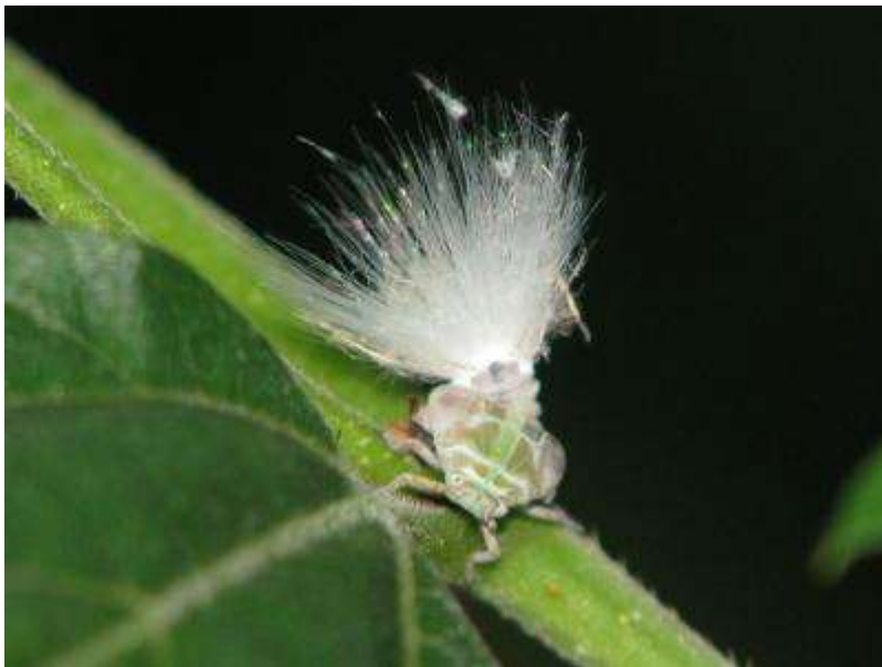
アミガサハゴロモの幼虫か？