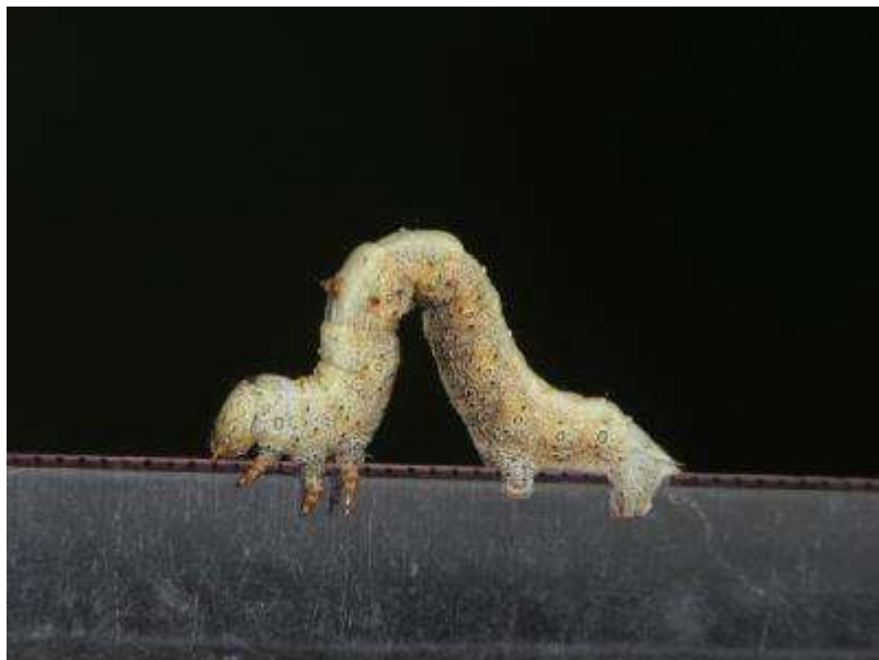
クローバーについていたヨモギエダシャクの幼虫その1