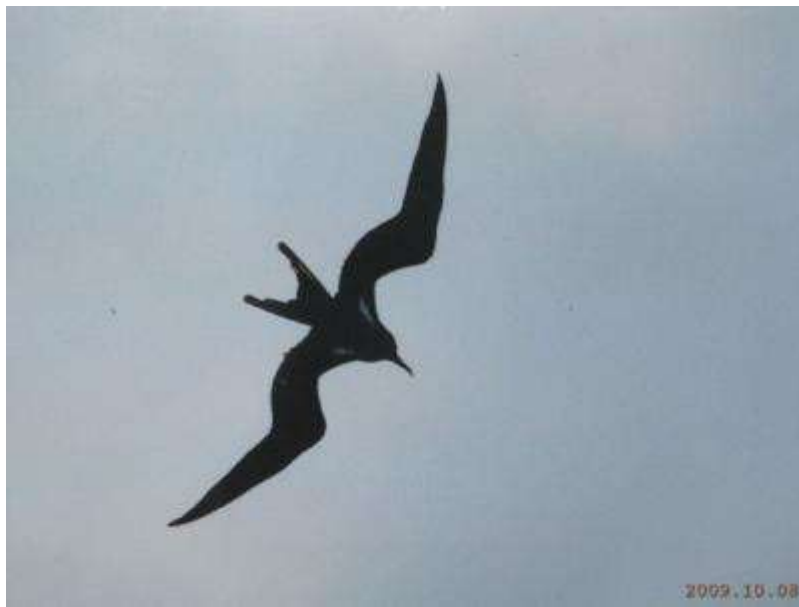
コグンカンドリ (2009年10月8日正午頃)

先日、日本本土を直撃した台風18号、各地に被害をもたらしましたが、手賀沼にはコグンカンドリを運んできました。