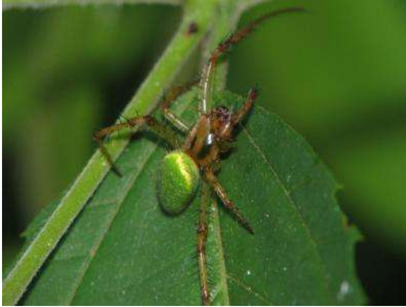
サツマノミダマシ