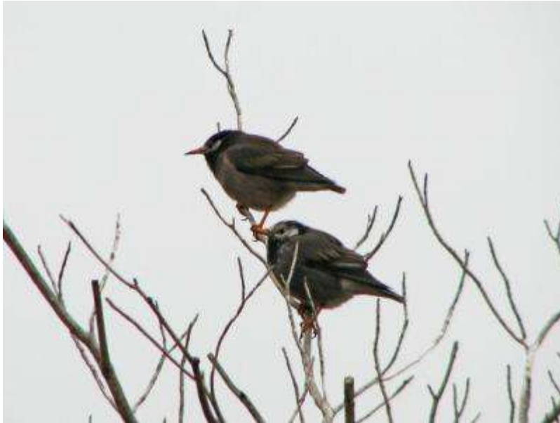
ムクドリのつがい (左: ♀、右: ♂)