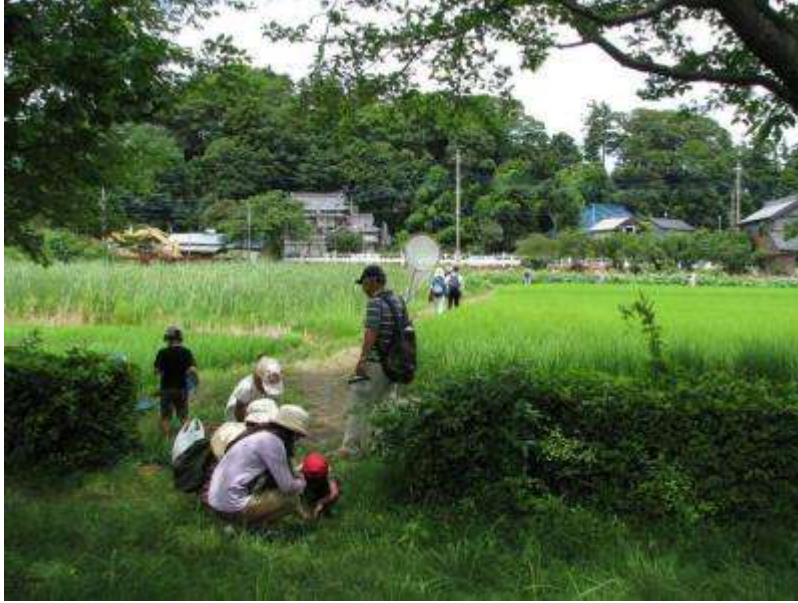
参加者の背後の遠くに見えるのは花蓮です

Copyright | Nucleus CMS v3.64 | Valid XHTML 1.0 Strict | Valid CSS | トップページに戻る | Since 15,Mar.2008