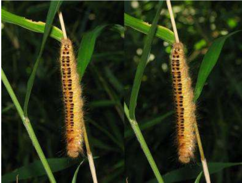
タケカレハ幼虫（立体視が得意な方はぜひ！）