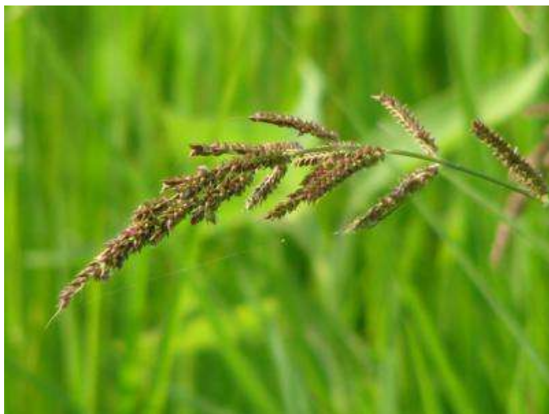
稔ったイヌビエの種