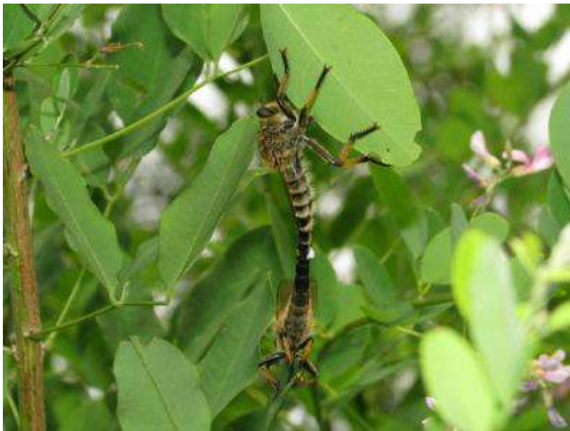
交尾中のシオヤアブ