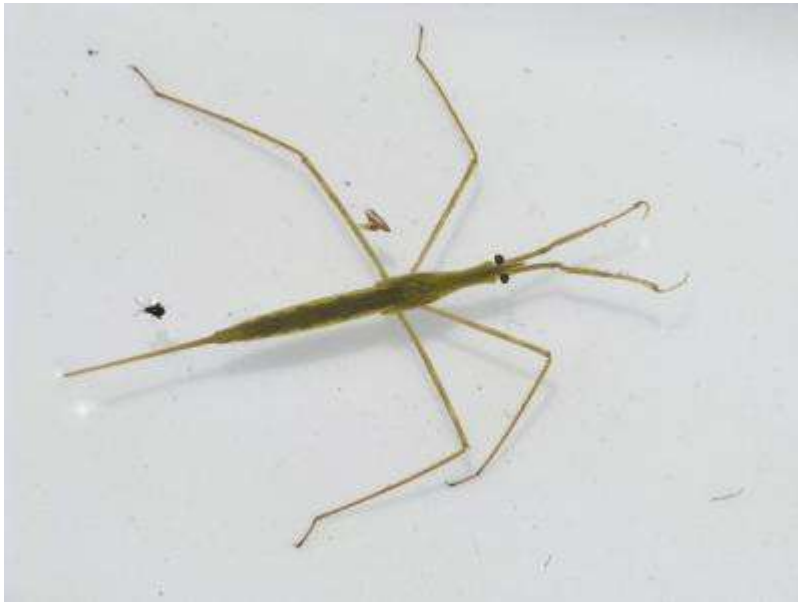
ミズカマキリの幼虫がいました（翅がまだのびていません）