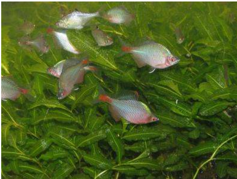
3階展望テラスで飼育中のタイリクバラタナゴ。水草はガシヤモク。底に2年間生存中のドブガイがいて、昨年はこの貝に産卵したタナゴが繁殖。