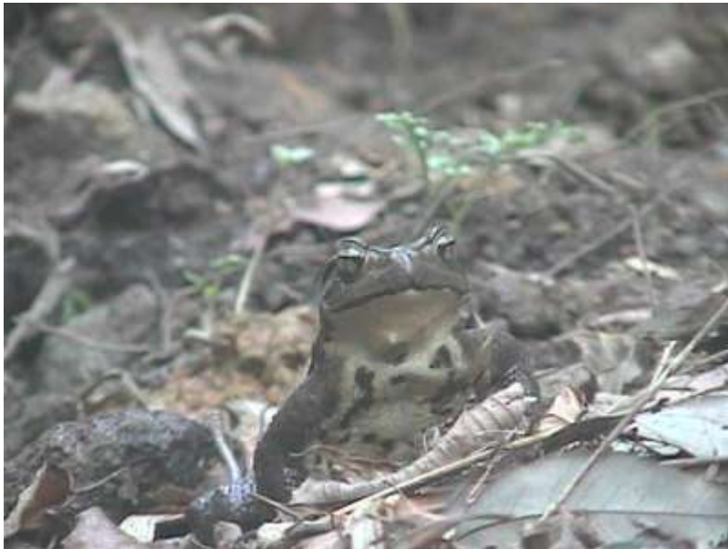
やって来たアカハラ