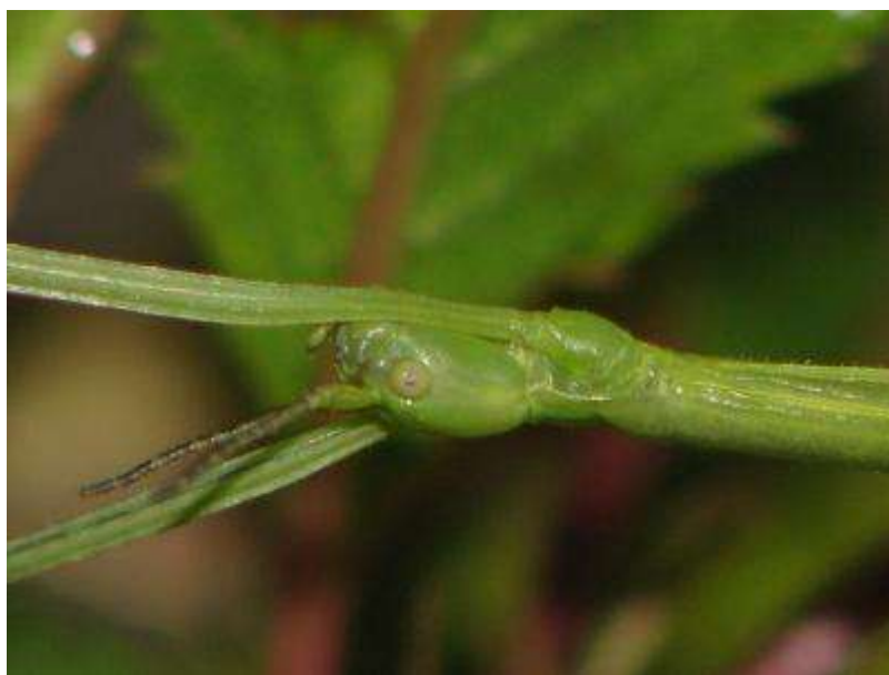
ナナフシモドキの顔