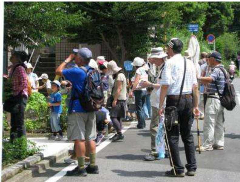
7月の「てがたん」にも沢山の参加者が来てくれました