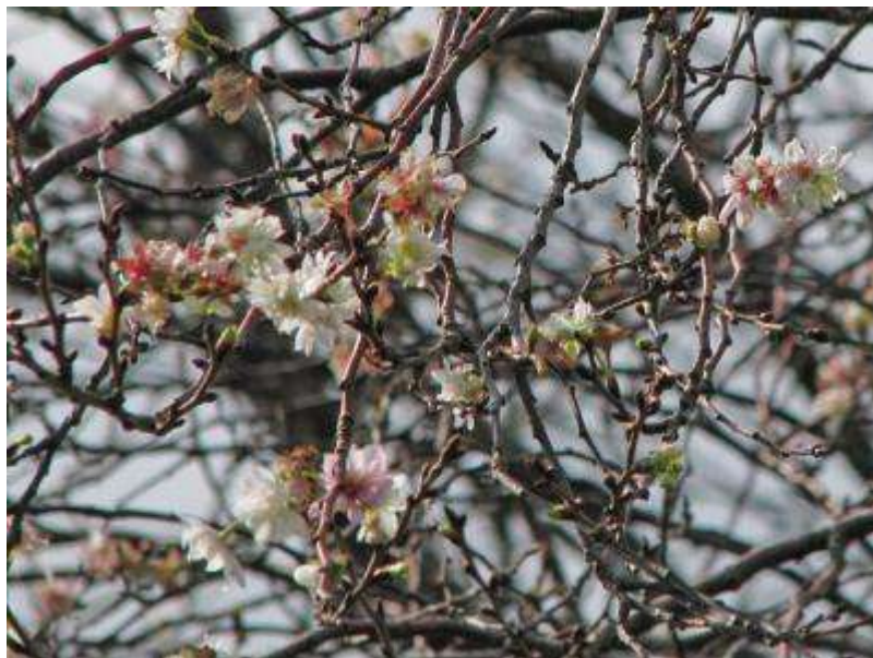
秋の花見！？二期咲きの里桜の‘十月桜’が満開でした。