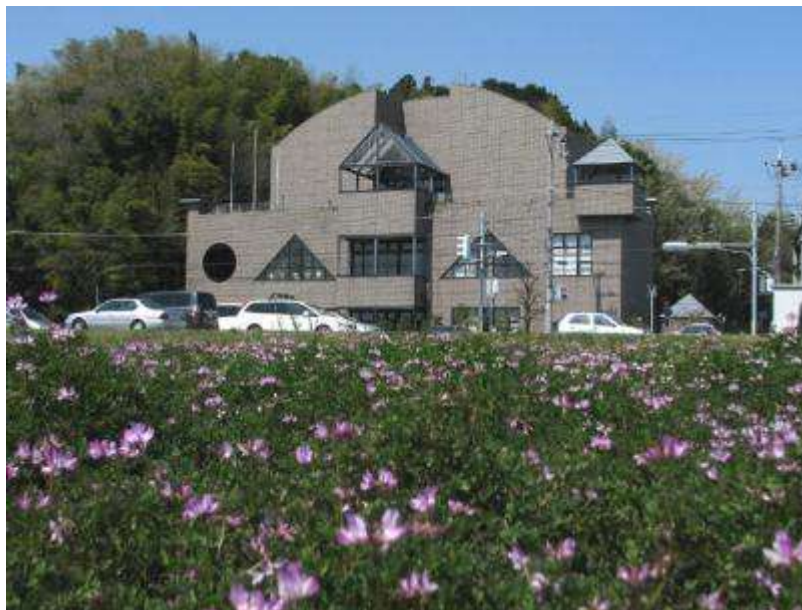
博物館前のゲンゲ畑の花も咲きました。