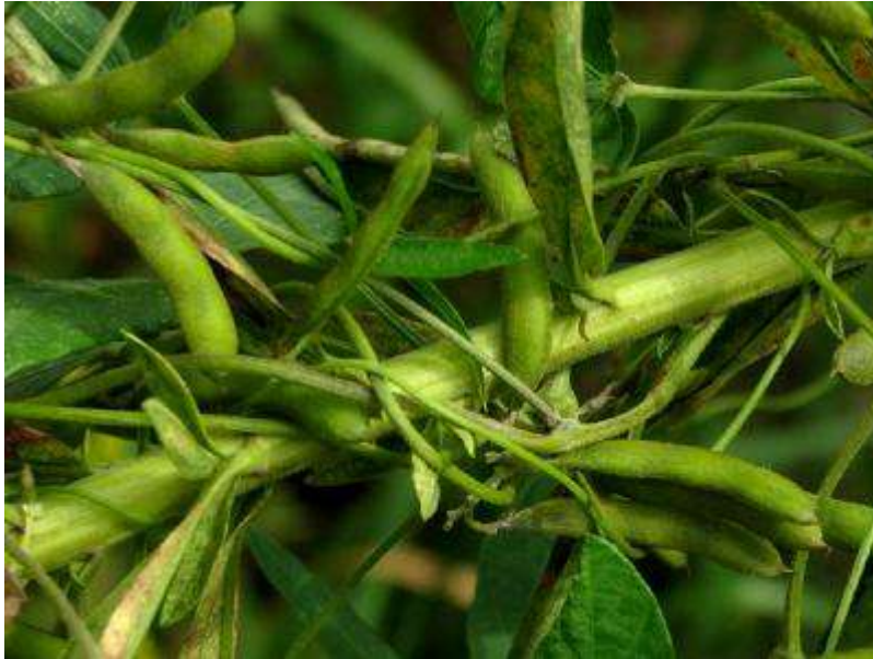
枝豆（大豆）の原種といわれるツルマメの果実。