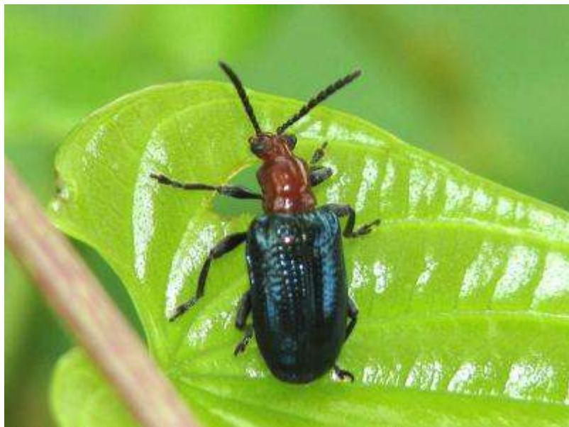
ヤマノイモの葉を食べるヤマノイモハムシ