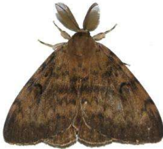
マイマイガのオスがメスを捜して舞っていました。触角は嗅覚センサー。