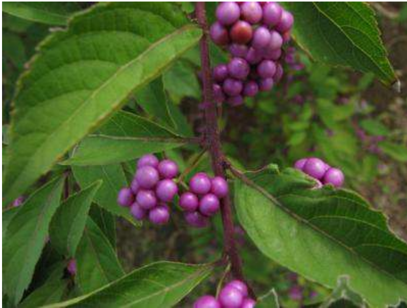
植栽されたコムラサキシキブの果実。