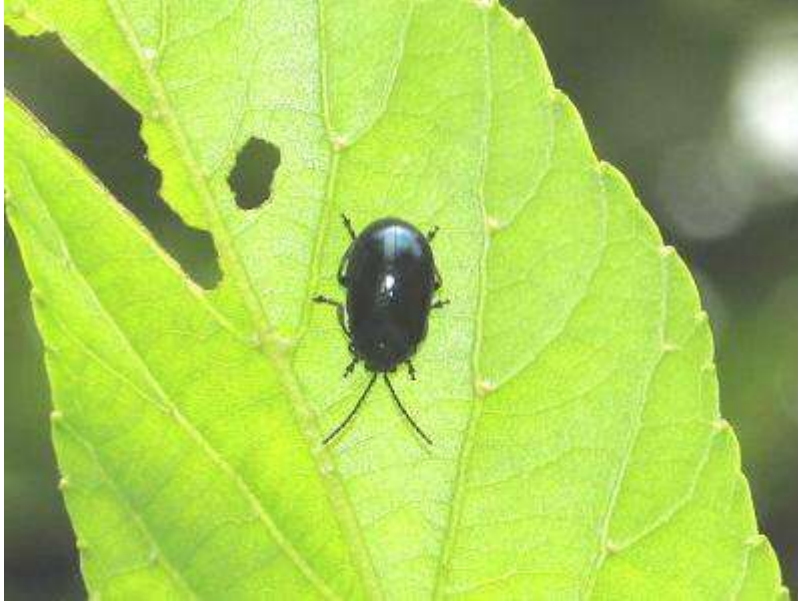
ハンノキハムシがハンノキの葉を穴だらけにしていました