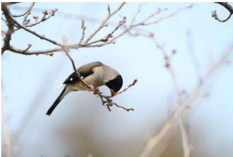
しきりに突つき食べている。