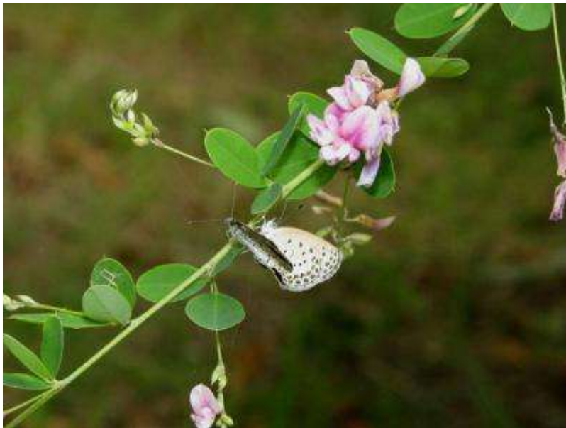
ヤマハギ樹上で交尾するヤマトシジミ（ヤマハギを食草とするルリシジミを記録したつもりだったのですが・・・先入観は禁物！）