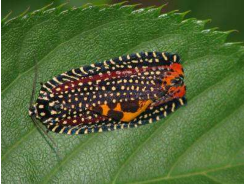
鳥博通用門近くのサクラの葉上で休むビロードハマキ♂