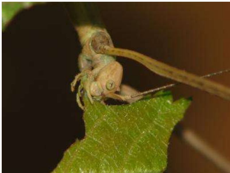
サクラの葉を食べる飼育中のナナフシモドキ