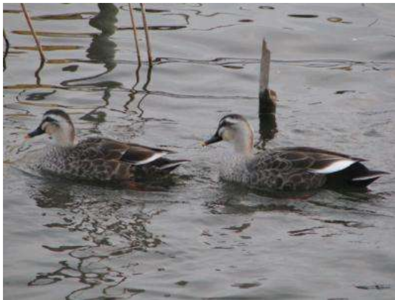
カルガモのつがい (左: ♀、右: ♂)