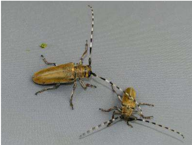
クワカミキリの雌雄