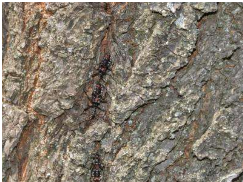
固まって越冬していたヨコヅナサシガメも動き出しました