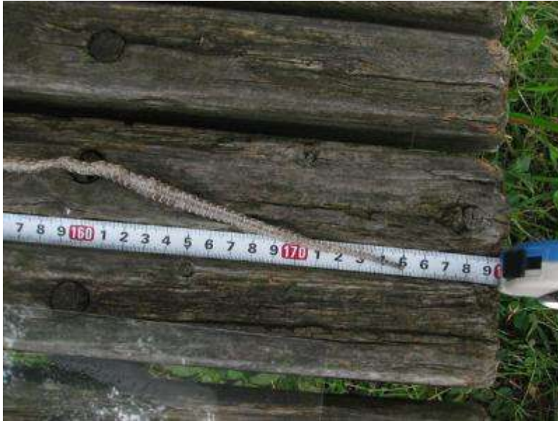
1 m 7 5 c m のアオダイショウでした。