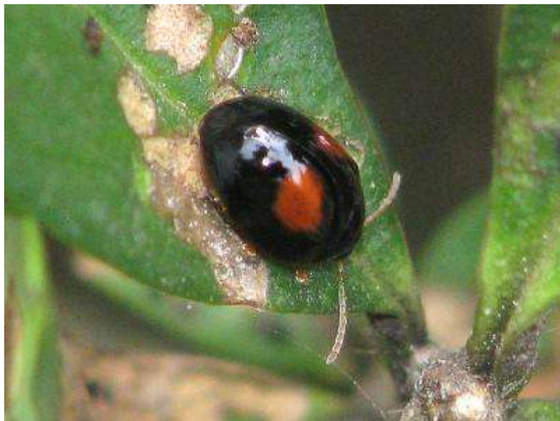
テントウノミハムシ (ヒメアカホシテントウそっくりのハムシでノミのようにぴょんと跳ねて飛び出します)