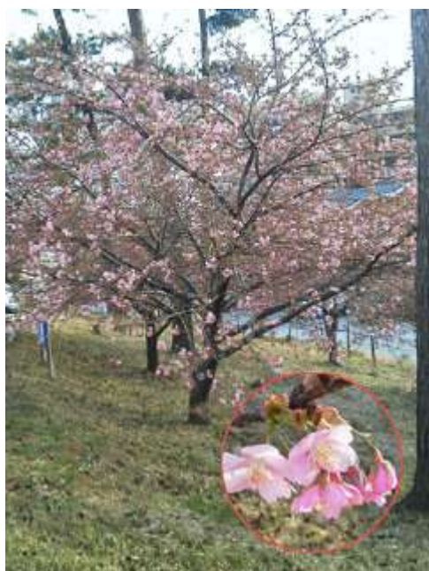
利根川向こうの取手市役所の"カワヅザクラ"が三分咲き！手賀沼ほとりの道の駅沼南の"カワヅザクラ"もそろそろか？気になるところ。