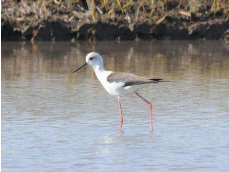
♀の成鳥と推定される個体。背中は雄より茶色っぽく見えます。