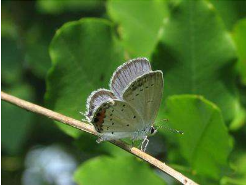
同じ場所にツバメシジミもいました