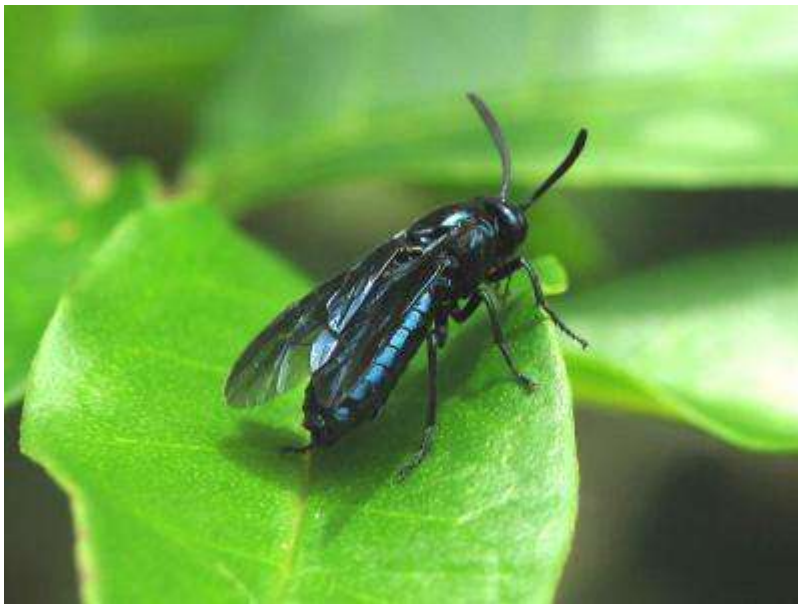
金属光沢のある瑠璃色が美しいルリチュウレンジバチ