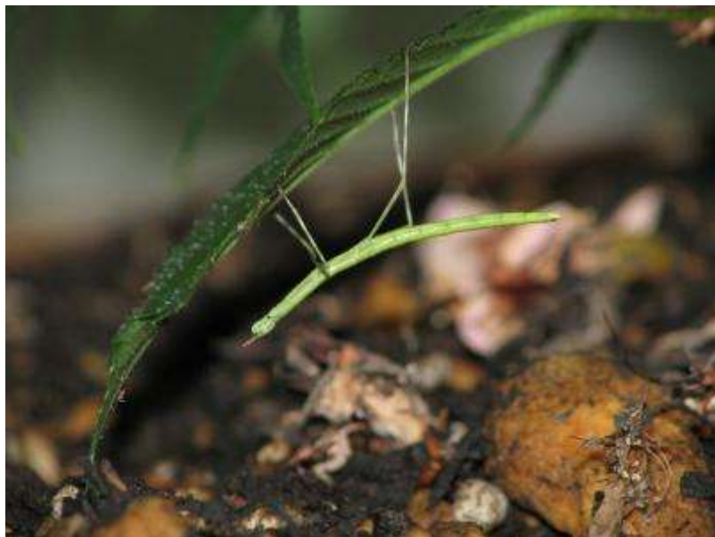
3月26日、前肢の基部にやや膨らみが見えます。再生の兆しか？