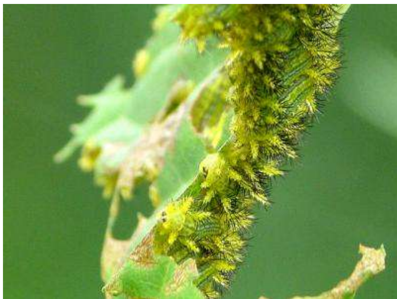
アオイラガの幼虫が桜の葉に群がっていました。要注意！