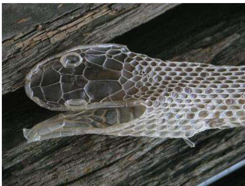
アオダイショウの抜け殻（桜の樹皮に張り付いていたそうです）