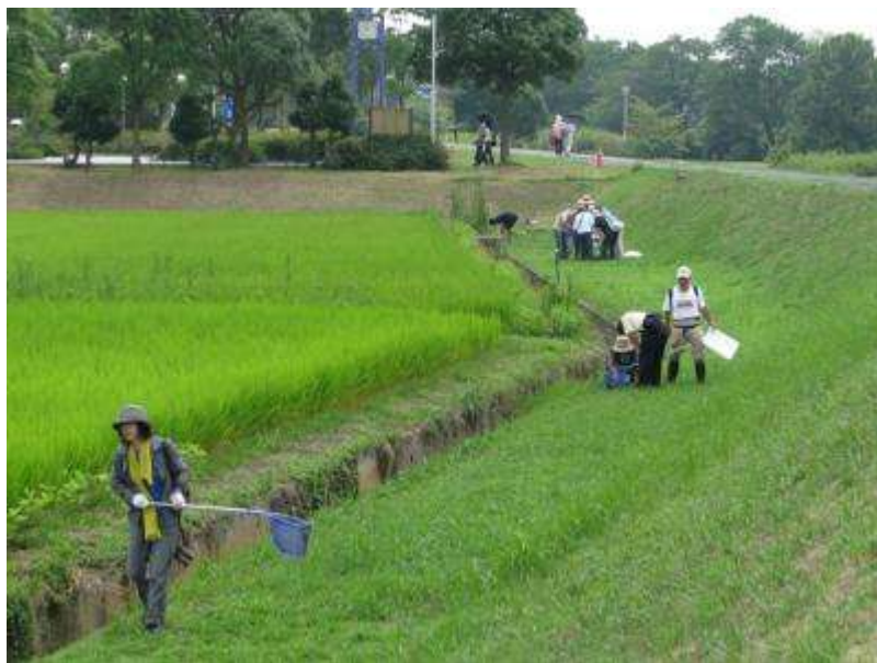
水の館前の水田わきの水路で魚捕りの予行演習

8月2日の下見の時に見た生き物の写真などです。本番（8月9日）の参考にしてください。テーマの割には、魚の写真がありませんが、悪しからず！魚は当日観察しましょう。