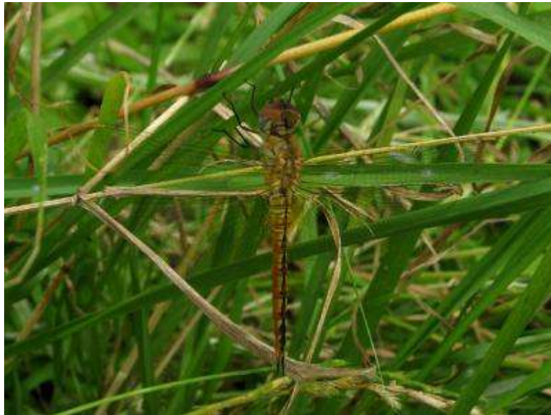
日中はいつも飛んでいるウスバキトンボも一休み。