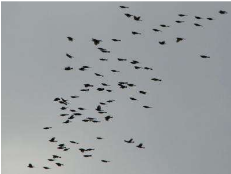
ヒヨドリの群れも南下中！