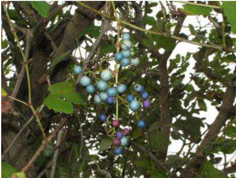
ノブドウの果実は、虫えいで色とりどり。