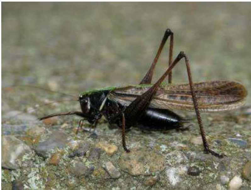
ヒメギス (長翅タイプの個体です)