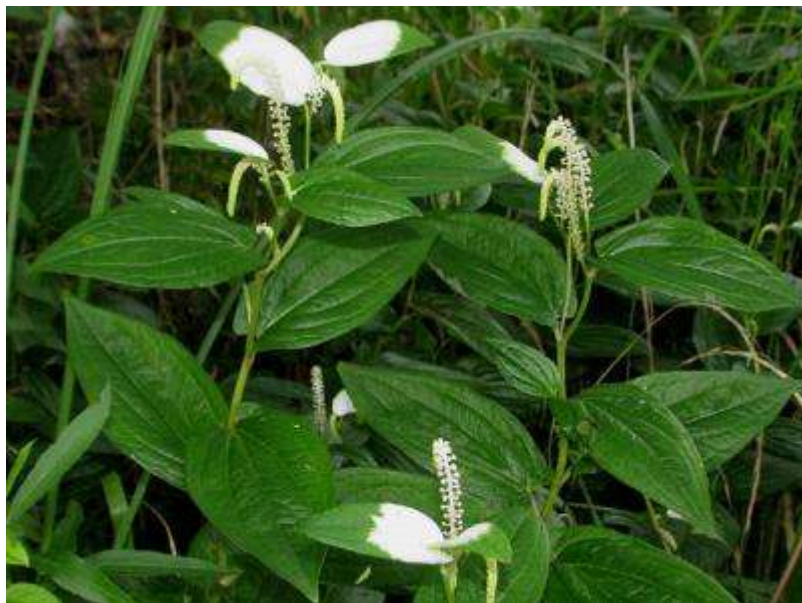
ハンゲショウ（半夏生または半化粧）

半夏生（季節を表す七十二候の一つで毎年7月2日頃）のころに咲くから、あるいは半分化粧したように斑入りだから等が名前の由来とか。