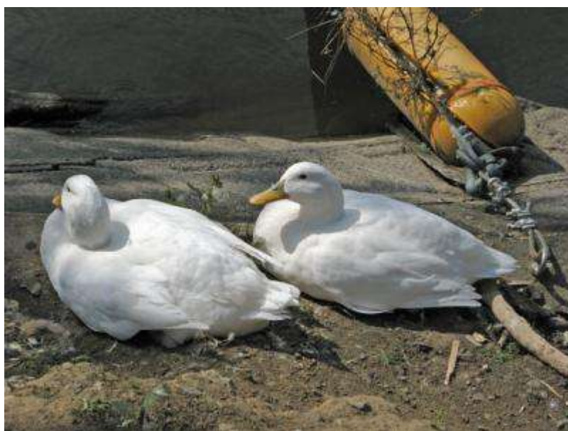
季節の鳥ではないけれど、白アヒルの雌雄分かりますか？原種マガモを思い浮かべながら、尾羽を観察！左がオス。