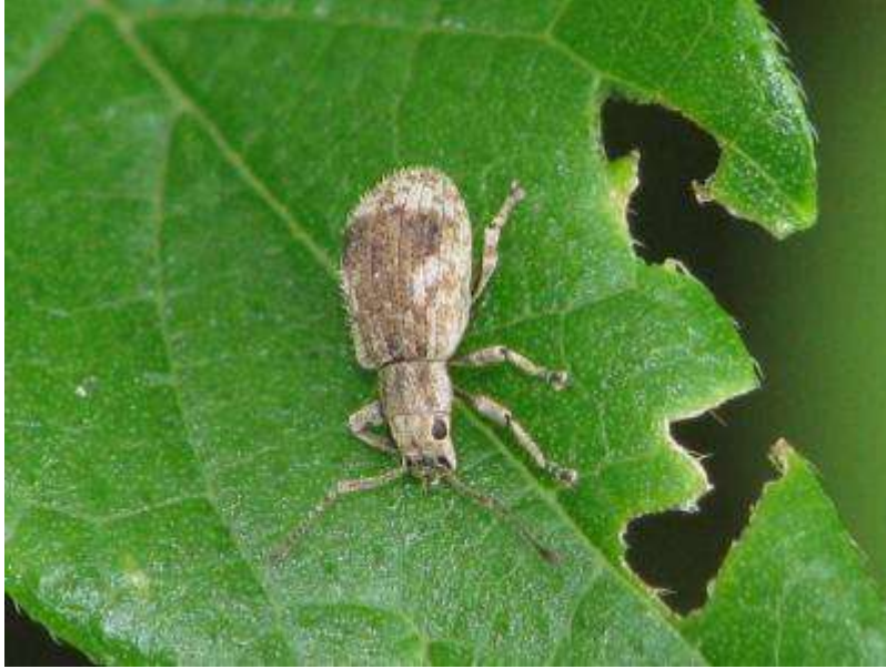
ヒレルクチプトゾウムシという名前のゾウムシ