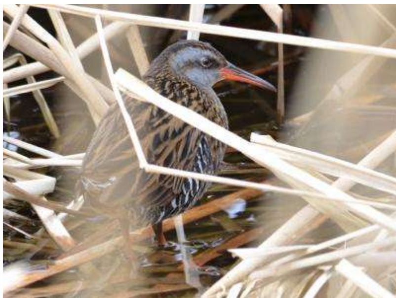
声はすれどもなかなか姿を見せないクイナ (2013.3.5)