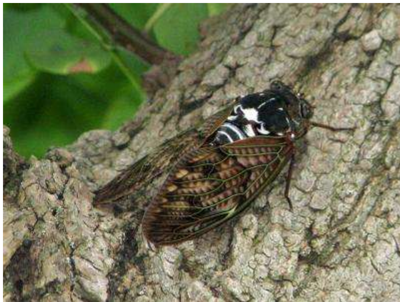
ニイニゼミがたくさん鳴いていましたが、今年初めてアブラゼミも確認。