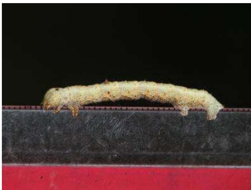
クローバーについていたヨモギエダシャクの幼虫その2