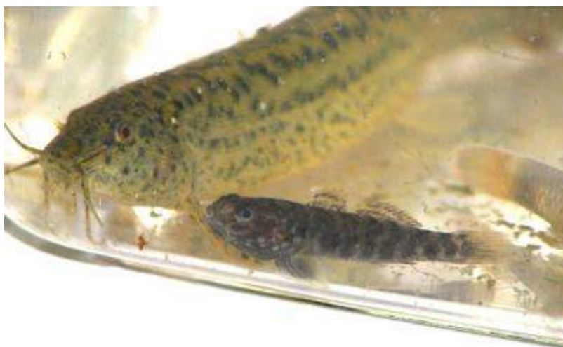
同水路では、ドジョウ（左）とヌマチチブ（右）も捕れました