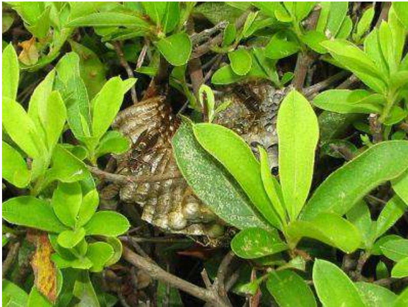
コアシナガバチの巣（付着点から一方向へ延びています）