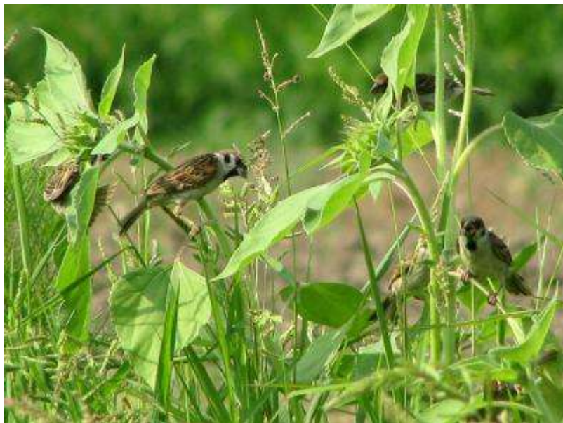
イヌビエの種子を食べるスズメの幼鳥群