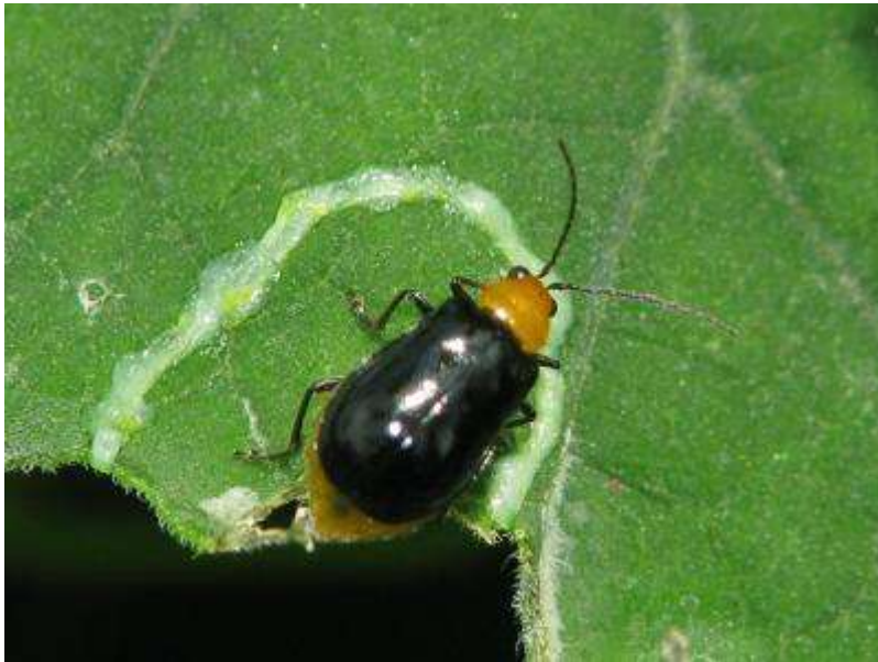
カラスウリの葉上のクロウリハムシ