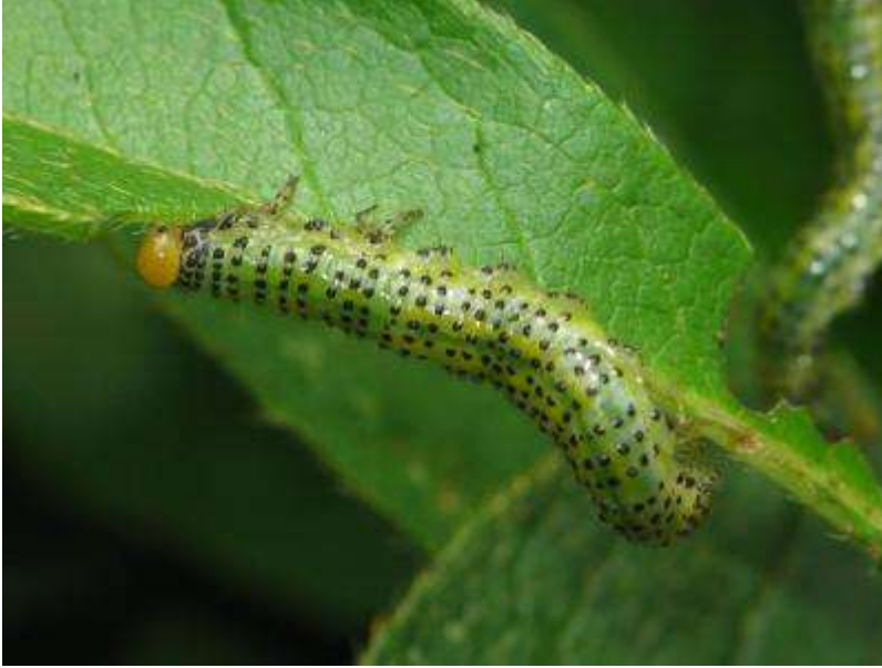
ルリチュウレンジバチの幼虫