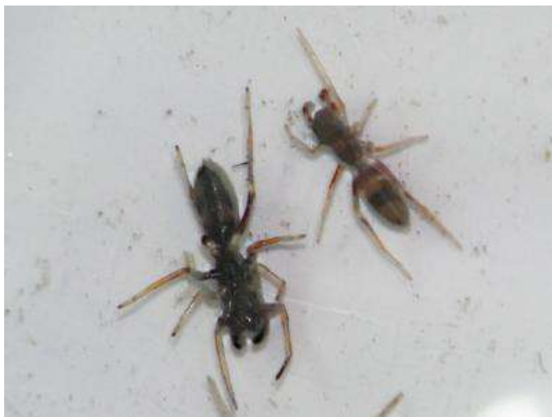
アリの姿そっくりのアリグモの仲間。

*この他、ゲジやムカデの仲間、クモの仲間…が多数回収されました。こもを巻いた植物を食害する、いわゆる“害虫”はほとんど見あたりませんでした。エノキを食樹とするゴマダラチョウの幼虫は、松とマツカレハの関係と同じですが…、“害虫”とは言いませんよね。