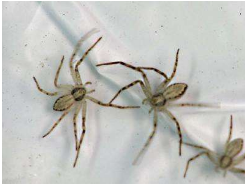
一番個体数が多かったのがエビグモの仲間（キンイロエビグモ）。