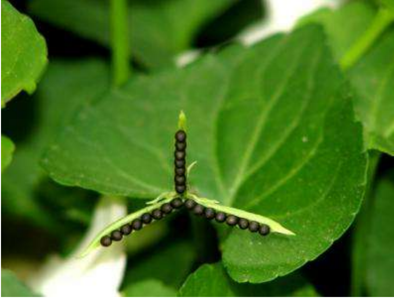
ニョイスミレの種子がはじけそう