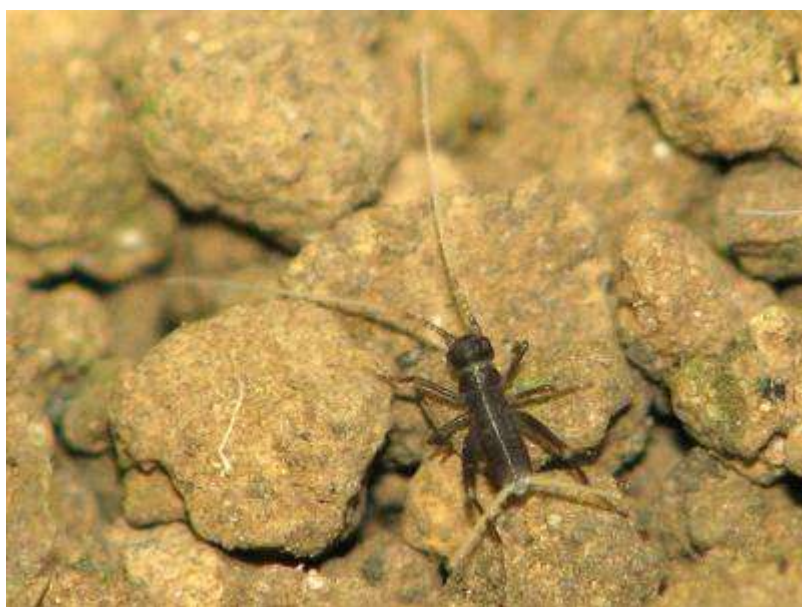
(孵化して1時間ほどで黒く色づきます)