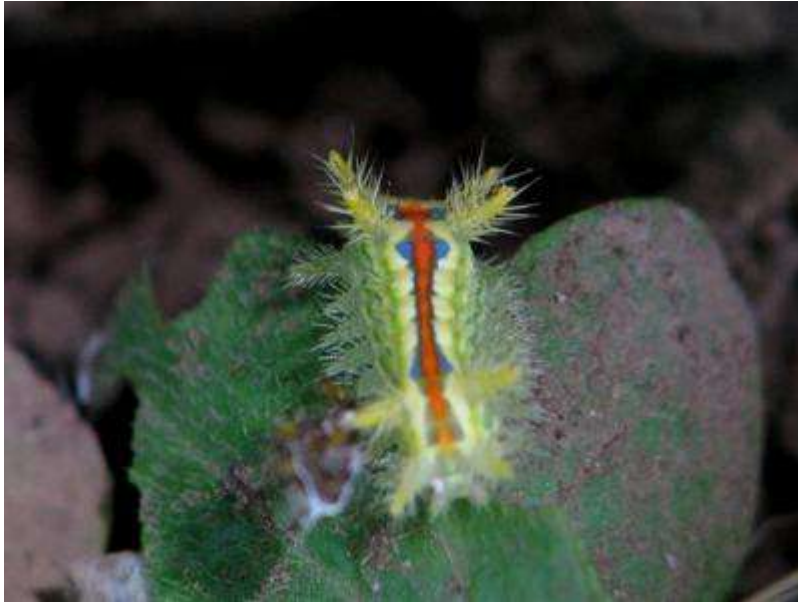
クロヘリアオイラガの幼虫