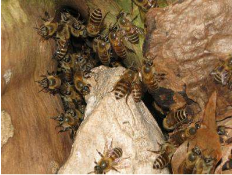
観察コース途中のイチヨウの樹の根元のニホンミツバチの巣