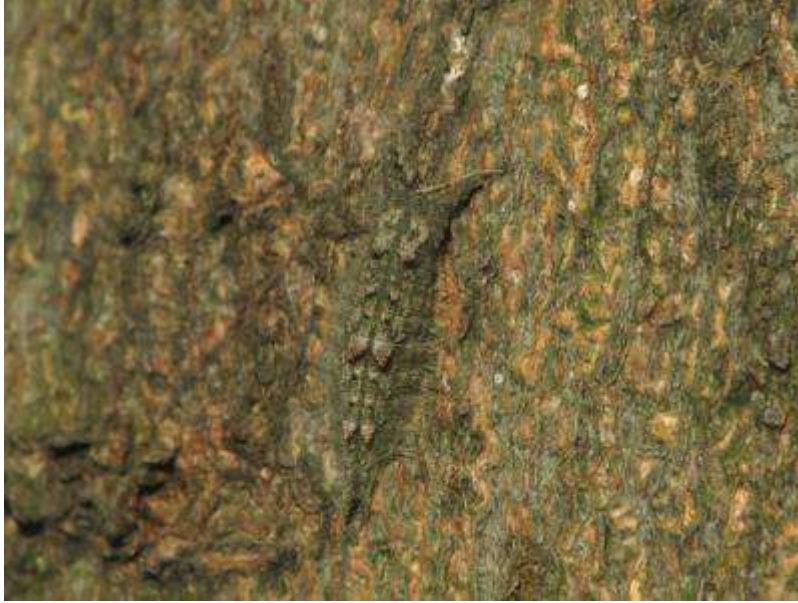
エノキの幹に巻かれたこもの中で越冬していたゴマダラチョウの幼虫。