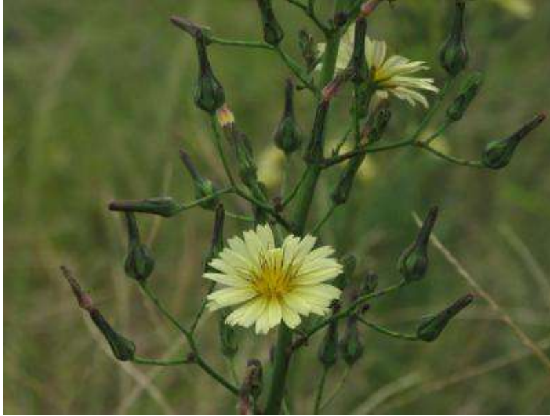
季節を感じさせる、アキノノゲシの花。