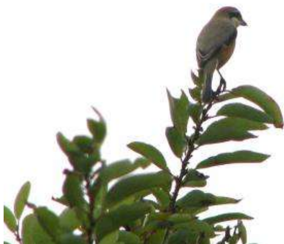
モズのオスが、ヒバリのさえずりをまねていました。