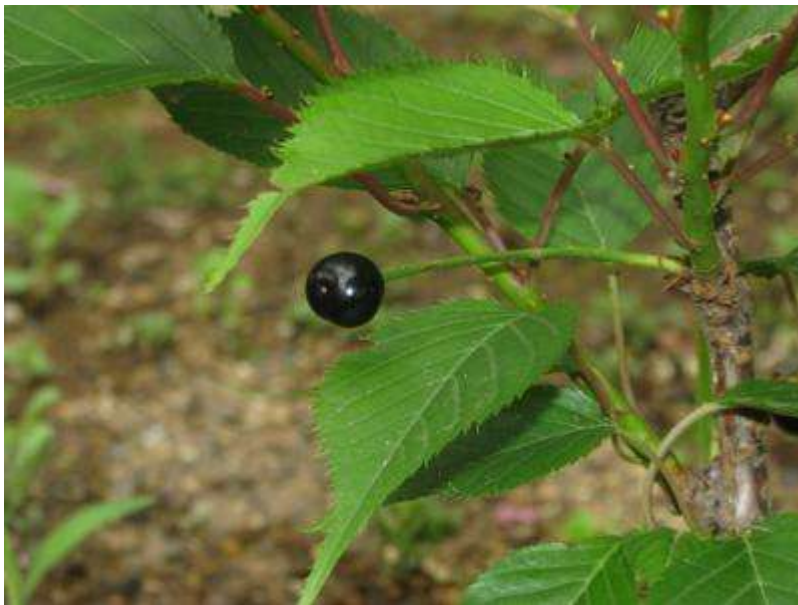
裏庭のサクラ（栽培品種‘旭山（アサヒヤマ）’で高さ50センチくらい）の果実が地面すれすれに完熟！