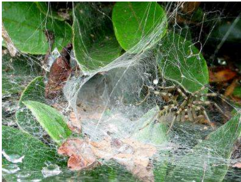
棚のように張った網で獲物を待つ、クサグモ