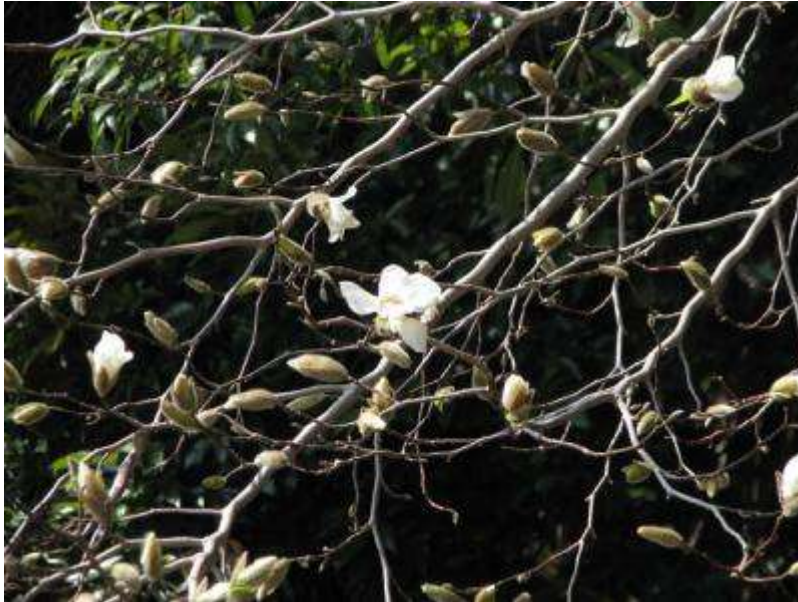
コブシの花が咲きました