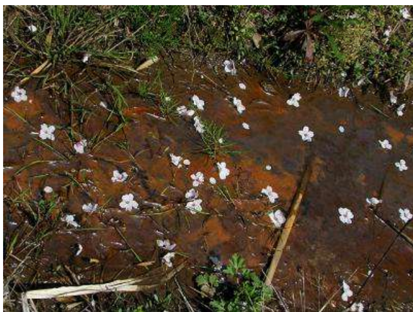
日本人に限らず、スズメも桜が好き！。花をちぎって花蜜を食べた残骸が、桜の樹の下に散らばっています。花見ならぬ花味か？。