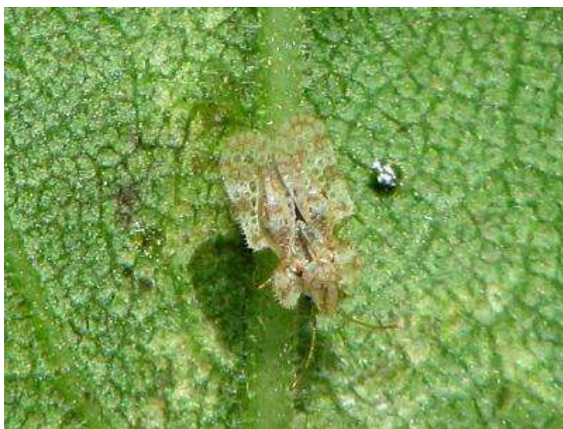
これは、セイタカアワダチソウグンバイ