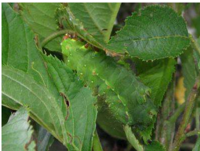
オオミズアオの幼虫（終齢）がサクラの幹を上っていました（繭をつくる場所を捜しているようです）