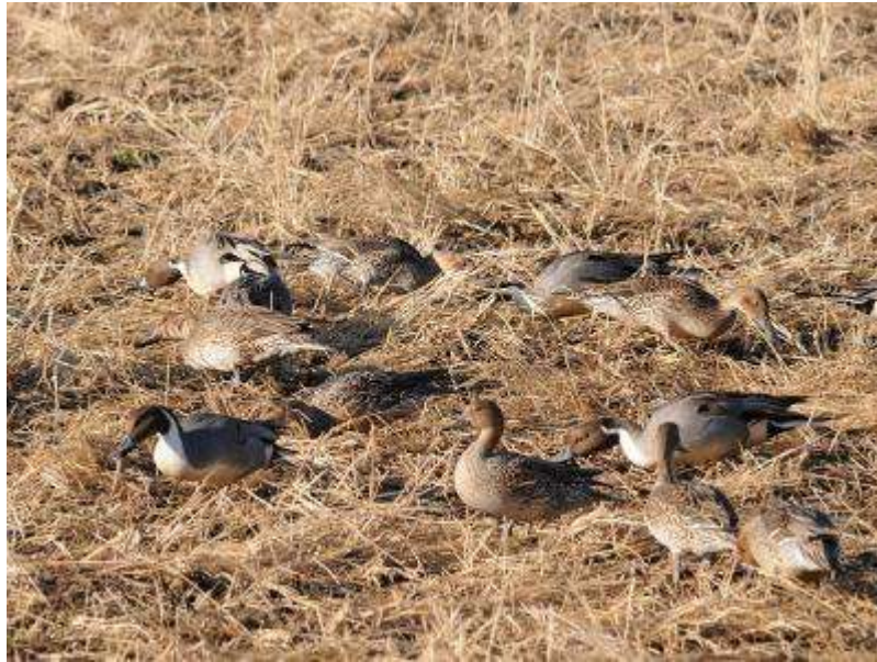
田んぼに降りているオナガガモの群れ。