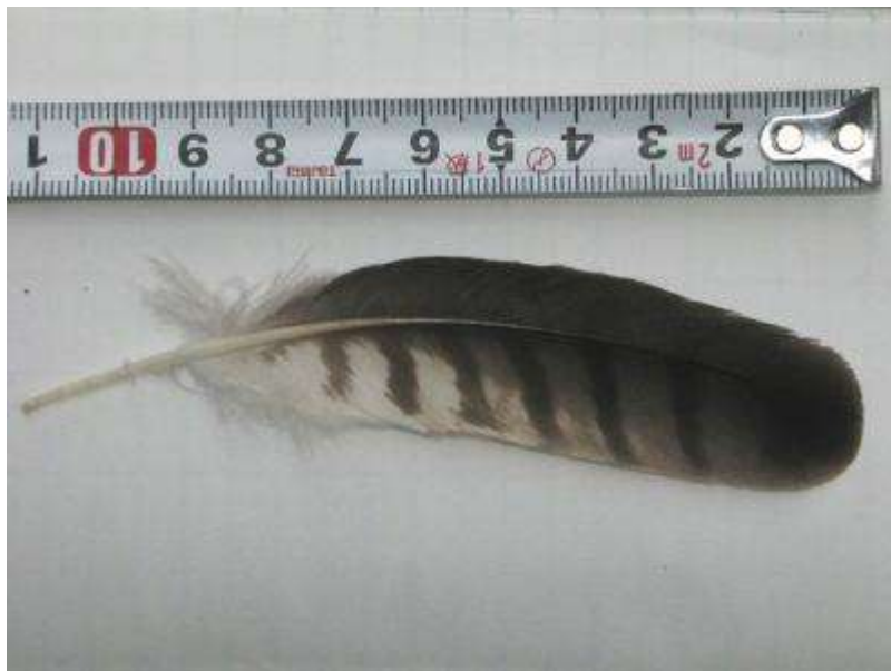
スタッフが近所でツミの羽毛を拾って来てくれました