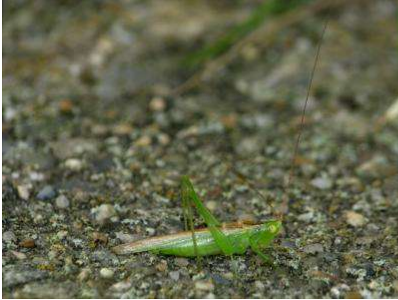
ウスイロササキリもいました。