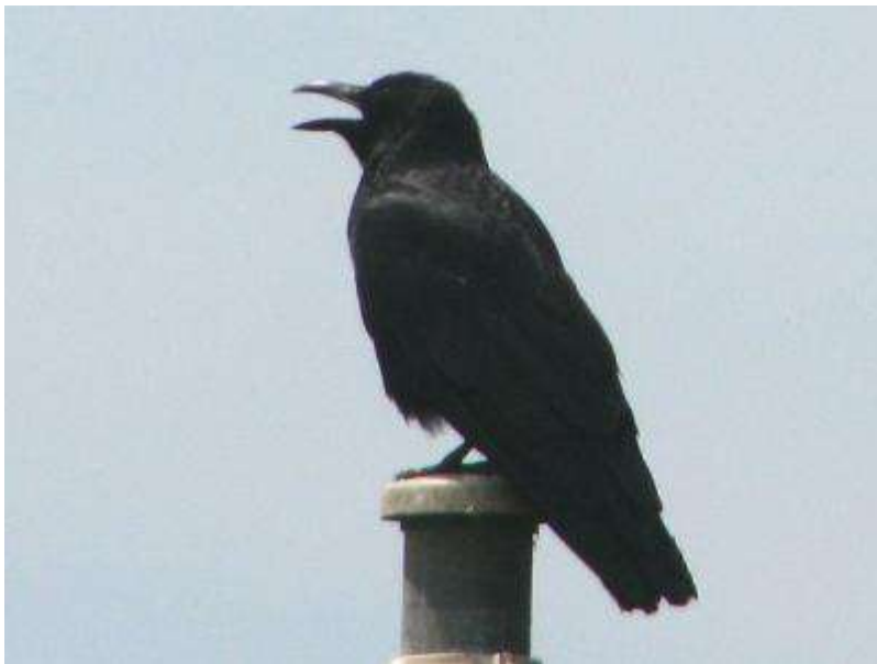
ハシボソガラスがあえぎ呼吸（パンティング）・・・暑い！