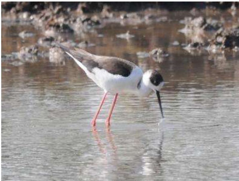
若い個体(昨年生まれ)と推定される個体。翼が全体的に茶色味を帯びています。