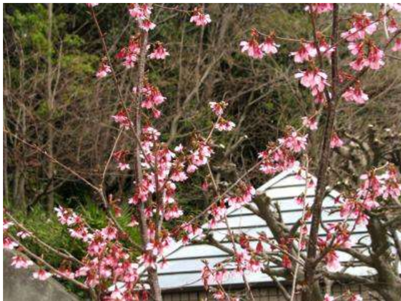
鳥の博物館裏門前の"オカメザクラ"満開！