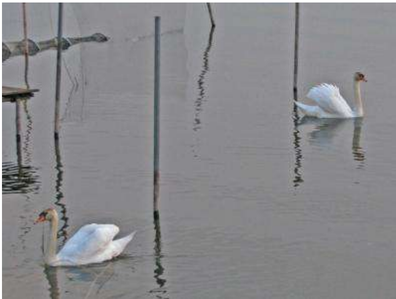
コブハクチョウのつがい (左: ♀、右: ♂)

手賀沼周辺では、シジュウカラ、ヒバリ、ホオジロのさえずっています。 ウグイスがさえずるのも、間近か？