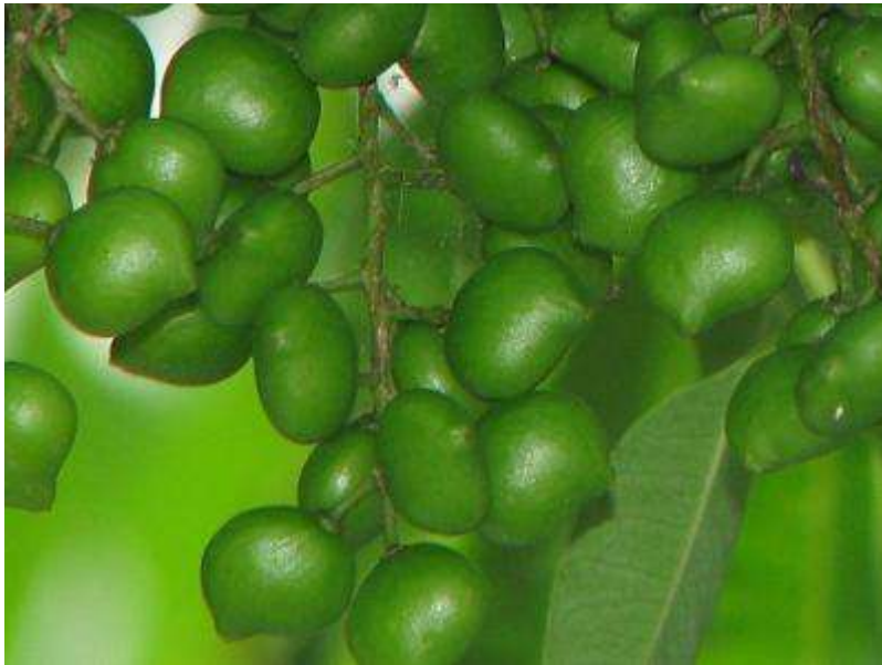
こちらはサツマノミ（薩摩の実）＝ハゼの果実