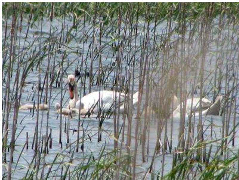
鳥の博物館前のヨシ原になわばりを持つコブハクチョウのつがいにヒナが誕生。