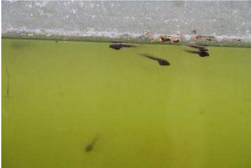
タイリクバラタナゴも元気に泳いでいる。