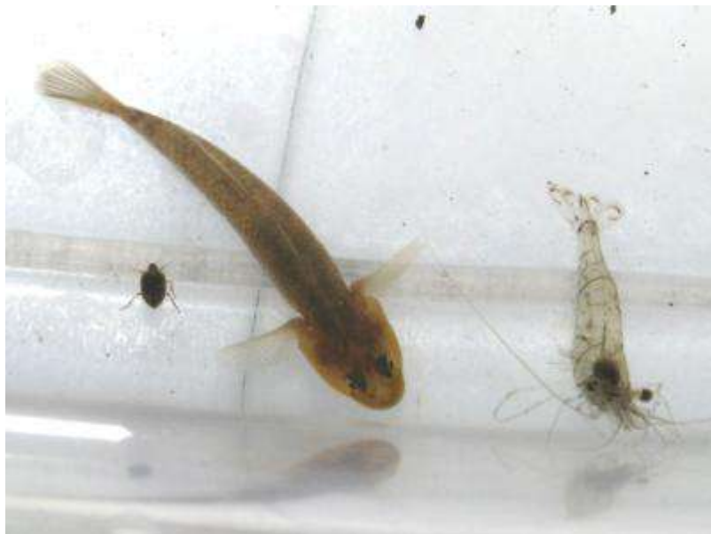
親水広場前の田んぼの水路で捕れたコガシラミズムシ（左）、トウヨシノボリ（中）、スジエビ（右）