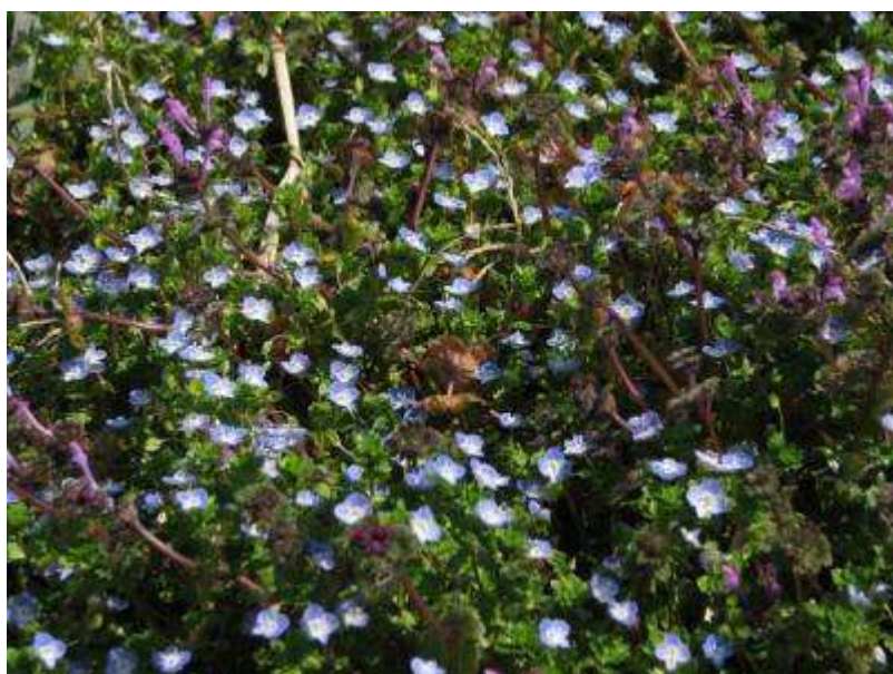
陽だまりの畦には、オオイヌノフグリやホトケノザの花が一杯！