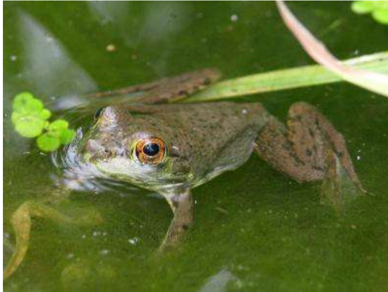
上陸したばかりのウシガエル。