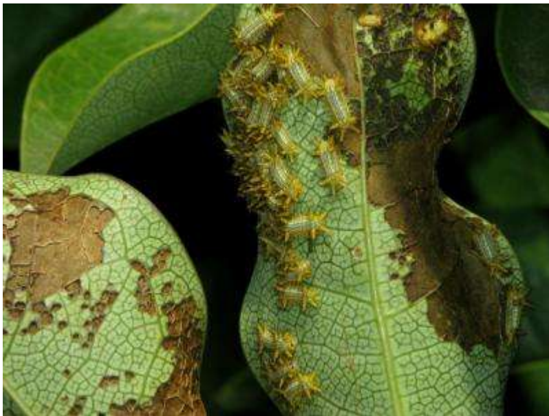
アオイラガの仲間の幼虫