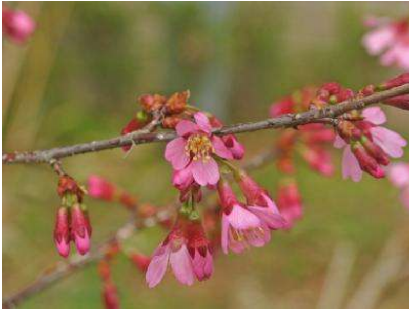
鳥の博物館職員通用門わきに植栽した'オカメザクラ（阿亀桜）'も開花！