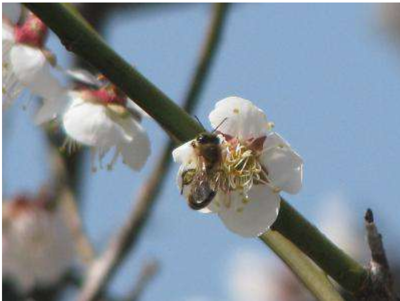
気温は20度以上にあがり、ミツバチも活動的です