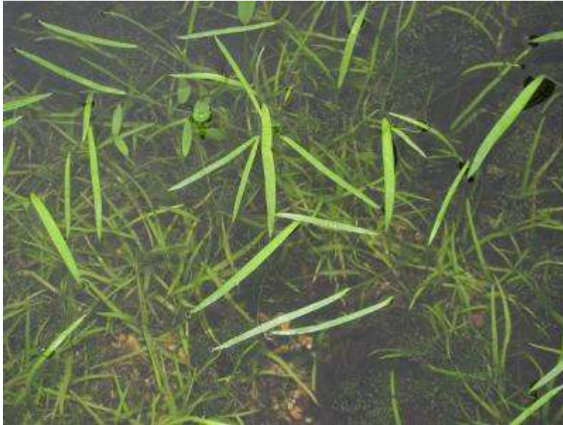
栽培しているミズアオイが発芽！ちょっと意外な葉の形。開花は7月頃か？