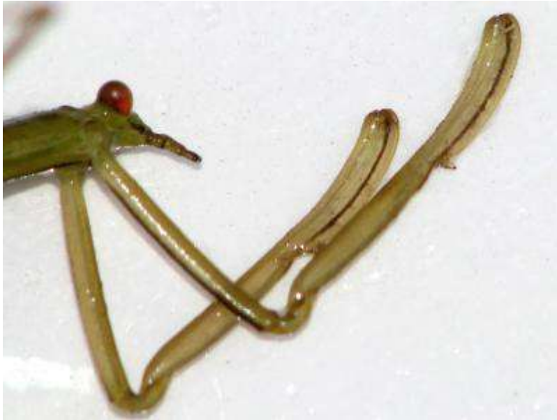
ミズカマキリのカマのアップ