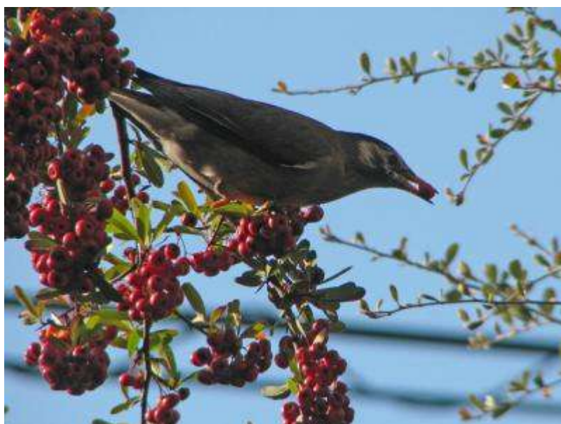
落ち着きなく群れでやってくるムクドリ