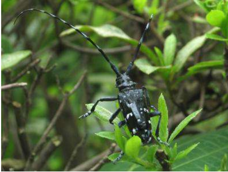
ゴマダラカミキリ