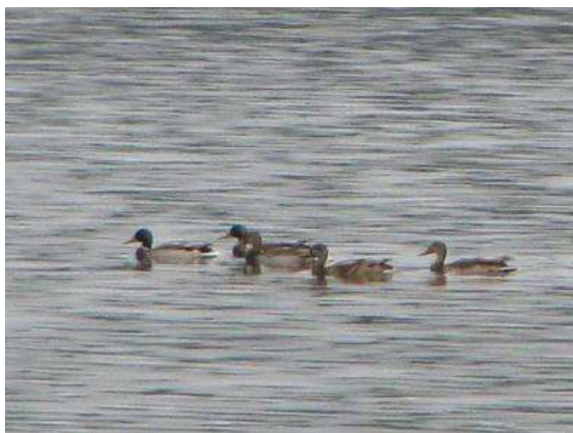
マガモのオス、エクリップス（非繁殖期の目立たない羽装）から繁殖羽に移行中のものも混じてました。