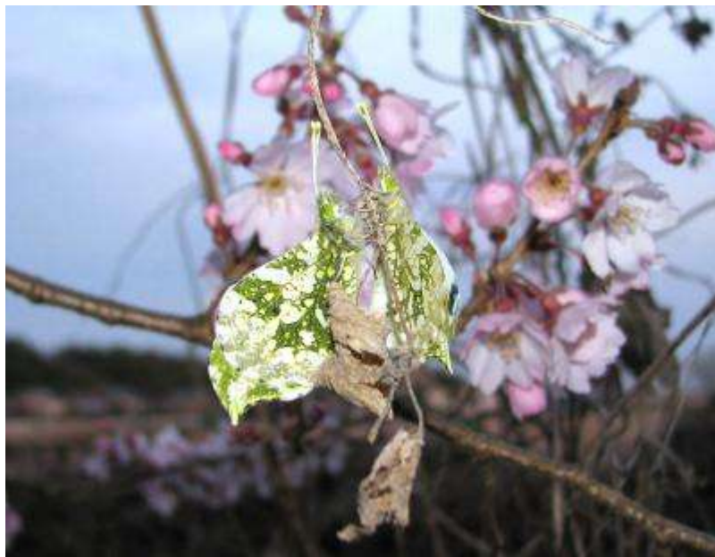
エドヒガンの花を背景にツマキチョウが交尾してました

3月29日の夕方、滝下広場の桜（エドヒガンとその改良品種の‘糸桜＝枝垂桜’）の花を見に行ったところ、ツマキチョウの雌雄が交尾していました（写真）。