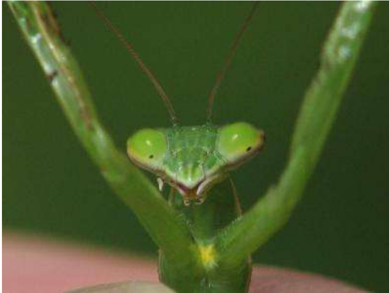
オオカマキリ幼虫