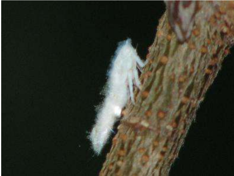
アオバハゴロモの幼虫