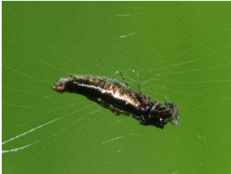
円網の体を横たえて（？）獲物を待つ、カラスゴミグモの雌