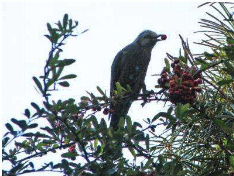
わがもの顔のヒヨドリ