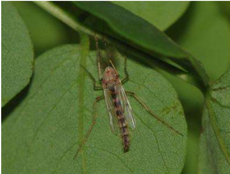
葉裏についた無数のユスリカを捕らえて雛に与えている模様 ユスリカは育雛期のスズメの有力な餌資源か!?