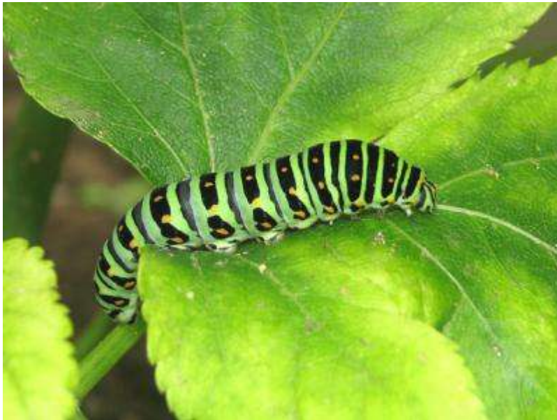
アシタバ（セリ科）の葉を食べるキアゲハの幼虫