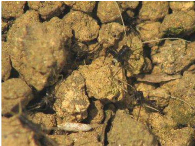
(卵と孵化後の幼虫)

孵化直後の幼虫は体長2ミリほど。まだ雌雄は分かりません。これから5~6回脱皮して、8月頃には鳴き始めることでしょう。