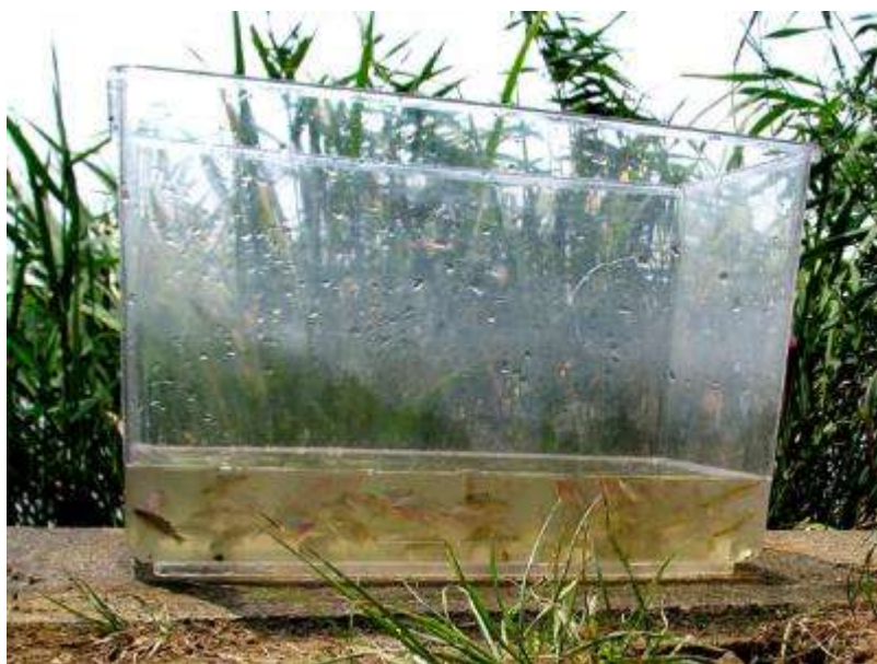
手賀沼のマコモ群落内にしかけた「もんどり」には、タイリクバラタナゴ多数とモツゴがいくつか入っていました