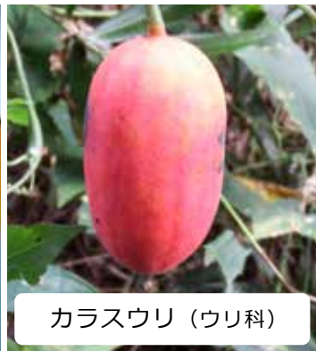
カラスウリ (ウリ科)