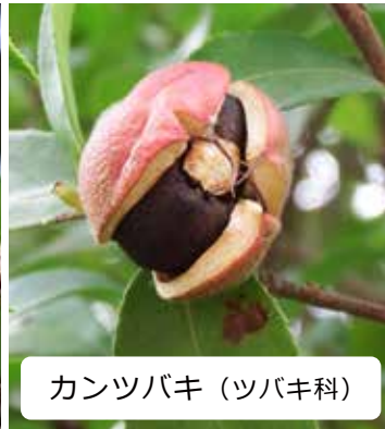
カンツバキ (ツバキ科)