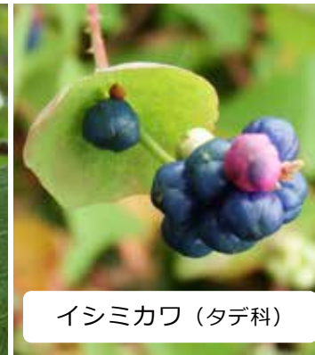
イシミカワ (タデ科)