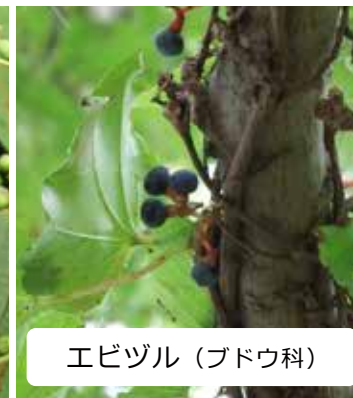
エビヅル (ブドウ科)