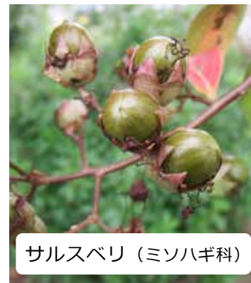
サルスベリ (ミソハギ科)