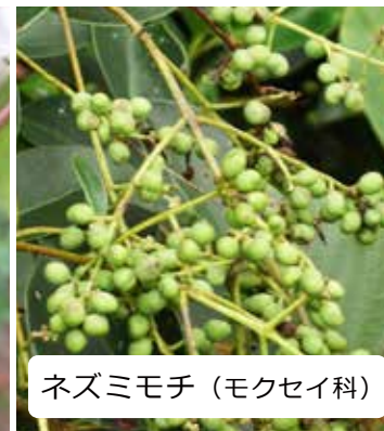
ネズミモチ (モクセイ科)