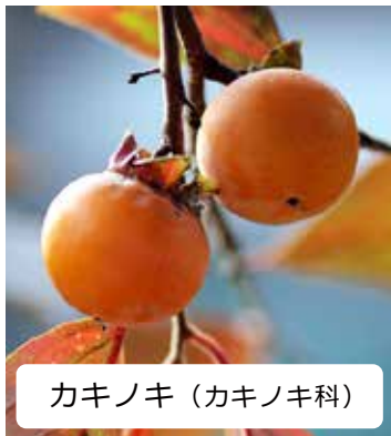
カキノキ (カキノキ科)