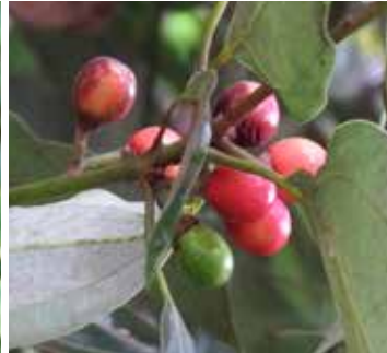
シロダモ (クスノキ科)