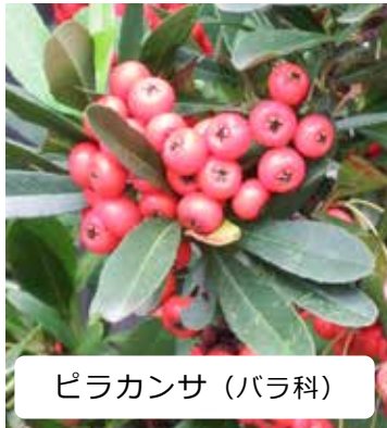
ピラカンサ (バラ科)