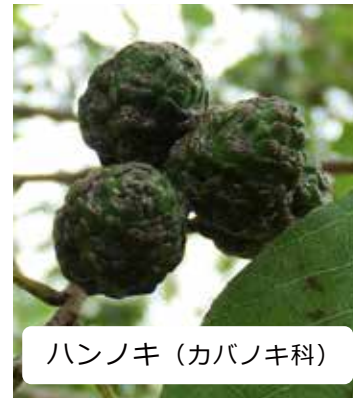
ハンノキ (カバノキ科)