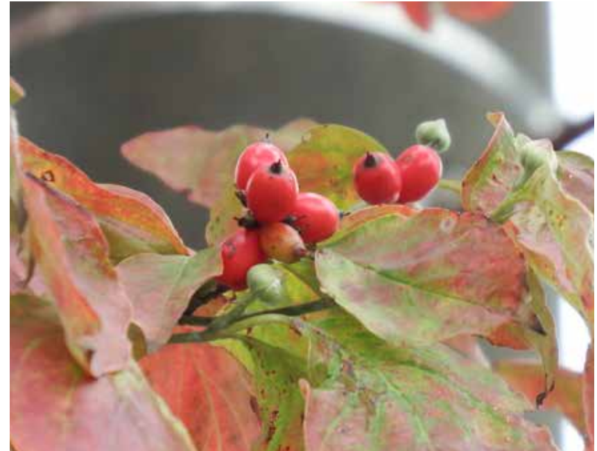
▲ 秋になるとだ円形の赤い果実が目立つハナミズキ