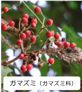
ガマズミ (ガマズミ科)