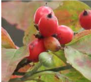
ハナミズキ (ミズキ科)