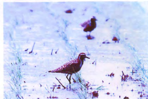
渡りの途中、田んぼで獲りしらすをムナグロ

鳥博月例手賀沼探鳥会について 我孫子市鳥の博物館では、博物館の目の前に広がる手賀沼も展示室の延長ととらえ、沼という舞台の上で季節ごとに変化する生き物たちをさがす観察会を始めることにしました。 この観察会は、おもに鳥を中心に観察します。もちろん、その途中、目に入る草花、木、昆虫、クモなど、時間の許す限り見つけてゆきたいと思っています。 「ちょっとその辺をさんぽ!」といった、1時間くらいの気軽な自然散策をイメージしています。 毎月1回、第2土曜日の10時からです。