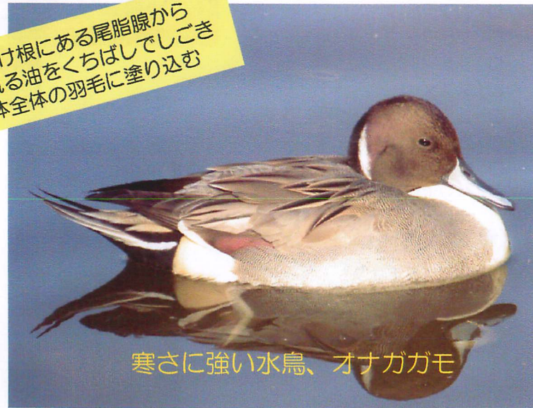
寒さに強い水鳥、オナガガモ

尾羽の付け根にある尾脂腺から分泌される油をくちばしでしごきとり、体全体の羽毛に塗り込む