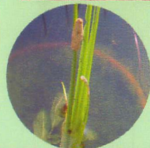
ショウブ (サトイモ科)