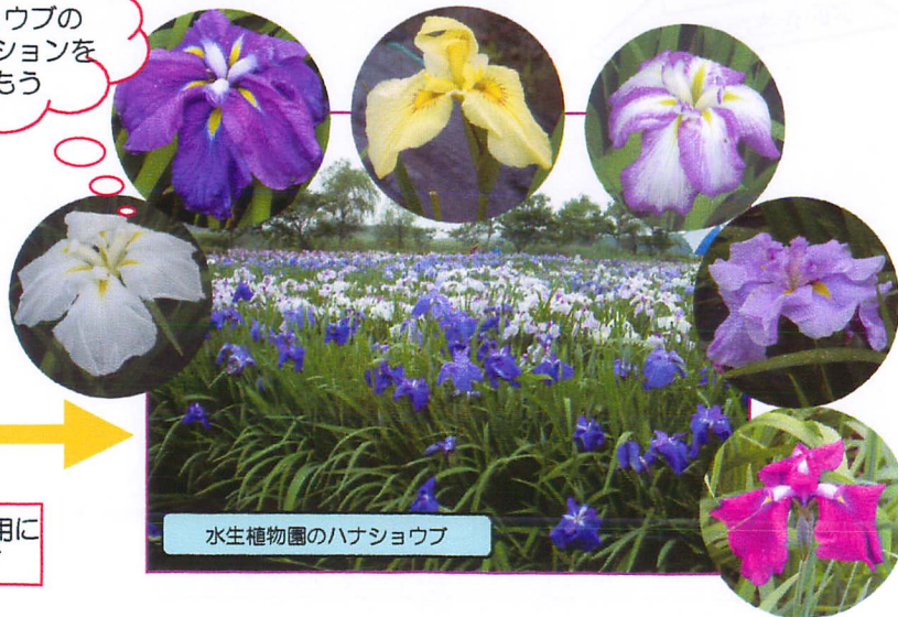
水生植物園のハナショウブ