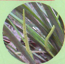
セキショウ (サトイモ科)