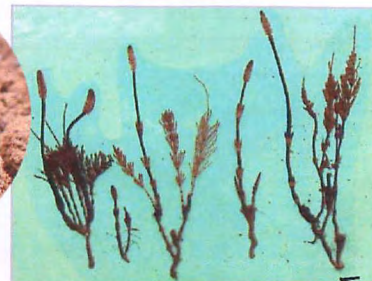
スギナとツクシ=スギナの胞子のう