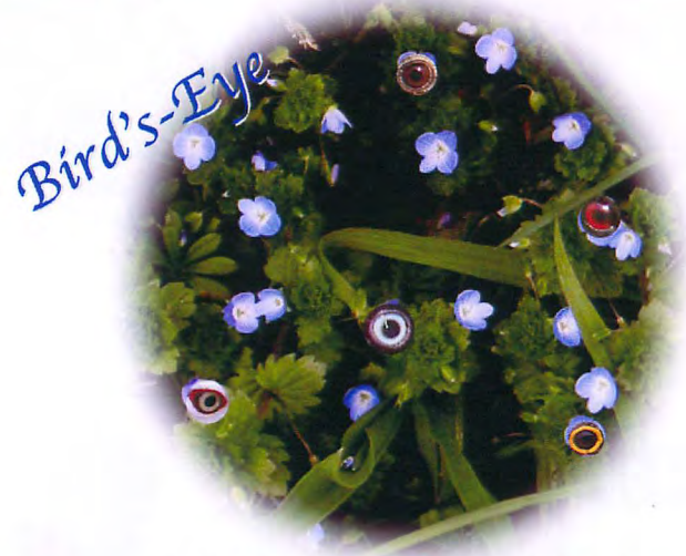
オオイヌノフグリ (ゴマンハグサ科, 英名: Bird's-Eye)