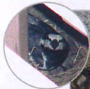
抱卵する ハクセキレイ♀