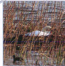
水辺の巣の中で抱卵する コブハクチョウの♀

★今、開催中の企画展の中で、身近な鳥の繁殖シーンをジオラマ展示しています。ぜひ、ご覧ください。(9月12日まで開催)