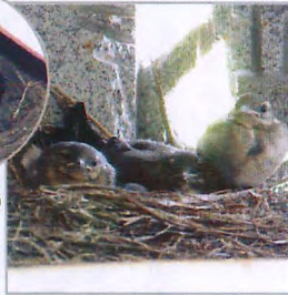
ヒナのいる ハクセキレイの巣