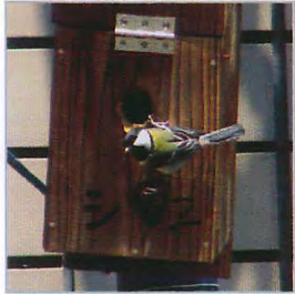
巣穴をのぞく シジュウカラ