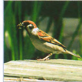
ヒナに餌を運ぶ スズメ