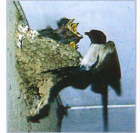
ヒナに餌を与える ツバメ