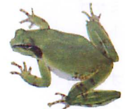
ニホン アマガエル