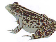
トウキョウ ダルマガエル