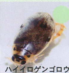
ハイロゲンゴロウ