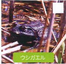
ウシガエル 体長15~18cm *外来種