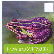
トウキョウダルマガエル 体長4~7cm *本州に分布