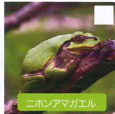
ニホンアマガエル 体長3~4cm *沖縄を除く全国に分布