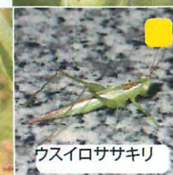
ウスイロササキリ