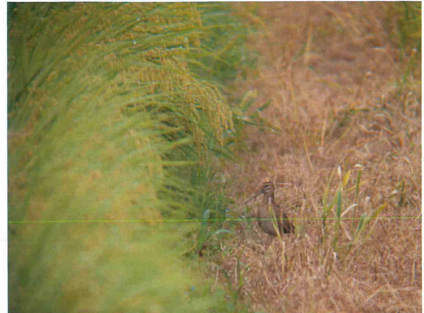
コメをつくる田んぼは、多くの鳥たちの生活の場でもあります。

日本人の主食であるコメ、世界中で主食になっている小麦やトウモロコシはイネ科の植物です。日本人は毎年平均して約60kgのコメを食べています。イネ科の植物なしには、私たちの生活は成り立ちません。今日は、身近な野生のイネ科・カヤツリグサ科にはどんな種類があるのかを観察してみましょう。