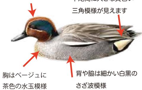
オス 成鳥 繁殖羽