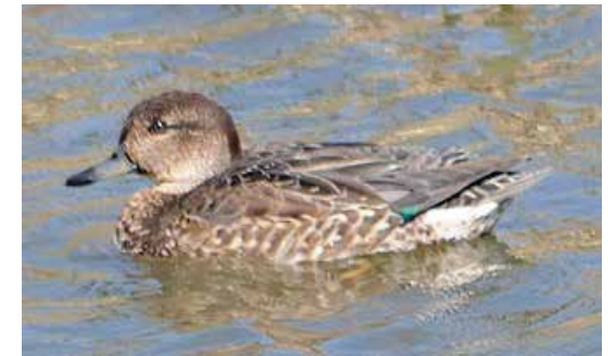
メス 成鳥 (11月)