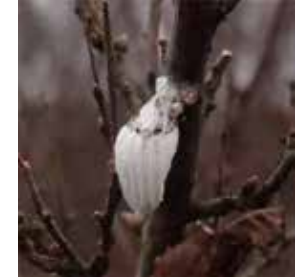
イセリアカイガラムシ