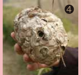
④ 遊歩道のツツジの中にあつたコスズメバチの巣