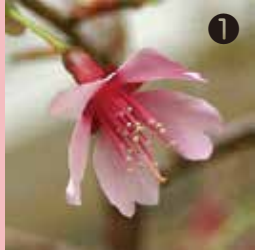
① 博物館の裏庭の‘オカメ’はイギリス生まれの品種

てがたんコース（手賀沼親水広場～滝下広場）では野生種3種と栽培品種13種が確認されており、栽培品種の‘染井吉野’がもっとも多く植えられています。