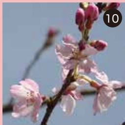
⑩ 滝下広場のエドヒガン この広場にはヤマザクラも植栽されています

‘枝垂桜’はエドヒガンから生まれた栽培品種です。エドヒガンは古くから寺や神社で栽培され、国の天然記念物に指定されているものもあります。