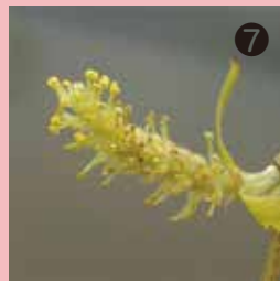
⑦ シダレヤナギの雄花 ヤナギ科は雌雄異株で植栽される多くが雄株です