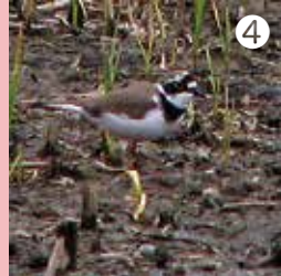
④ 手賀沼沿いの砂利などで繁殖する夏鳥のコチドリ