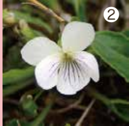
② 水田の畦で見つけたアリアケスミレ