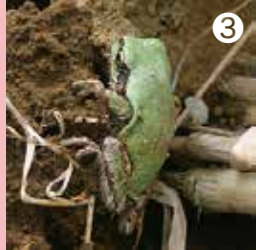
③ てがたんでは今年初記録のニホンアマガエル