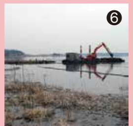
⑥ 手賀沼内で新しい植生帯を造成中で、ヨシなどの水生植物が運ばれていました