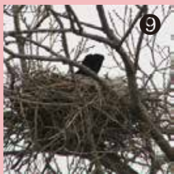
⑨ ほぼ毎年ハシトガラスが巣をつくる木では、今年も繁殖が始まりました