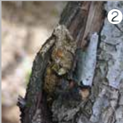
② 斜面林で見つけたハゼノキの種が入った哺乳類のフン