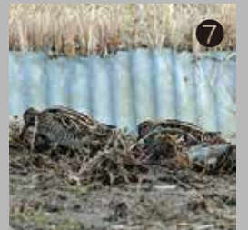
⑦ フジ棚横の田んぼでタシギを3羽観察