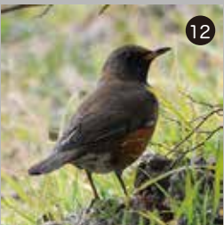
⑫ 下見の最後に姿をみせたアカハラ

フジ棚横の田んぼで餌を食べていたタシギ。よく見てみると小さなアメリカザリガニでした。