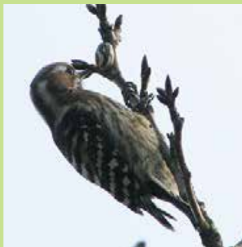
イラガの繭をつくコゲラ

手賀沼遊歩道沿いのサクラでは、イラガのまゆをつくコゲラの姿をしばしば見かけます。イラガの固い繭（まゆ）の中にある前蛹（ぜんよう）がお目当てのようです。餌が少ない冬の間、コゲラにとって貴重なタンパク源になります。