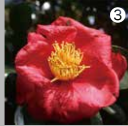
③ ヒヨドリやメジロがよく食べるサザンカの蜜や花粉