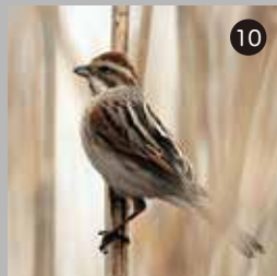
⑩ 餌が少ないせいか、人目も気にせず餌を探すオオジュリン