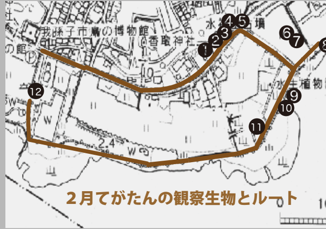
2月てがたんの観察生物とルート