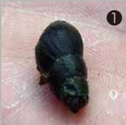
① 斜面林を流れる水路で見つけたカワコナ