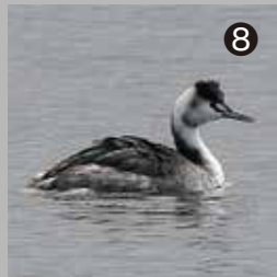
⑧ 手賀沼を泳ぐカンムリカイツブリ