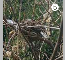
⑤ 斜面林で見つけたヒヨドリ？の巣