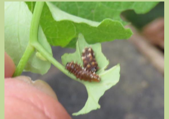
⑤ ジャコウアゲハの幼虫は、生えはじめたばかりの、小さなウマノスズクサを食べていました。