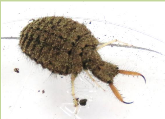
④ 博物館の東側の通りでは、ウスバカゲロウの幼虫（アリジゴク）を観察しました。大きなキバが特徴です。