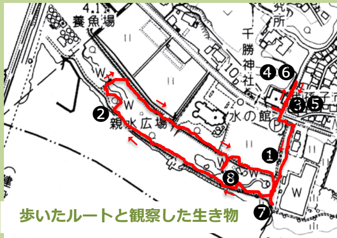
歩いたルートと観察した生き物