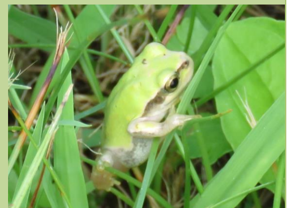
⑧ ニホンアマガエルが何匹も見つかりました。雨の日にはさかんに活動します。この日は雨上がりで地面がぬれていました。