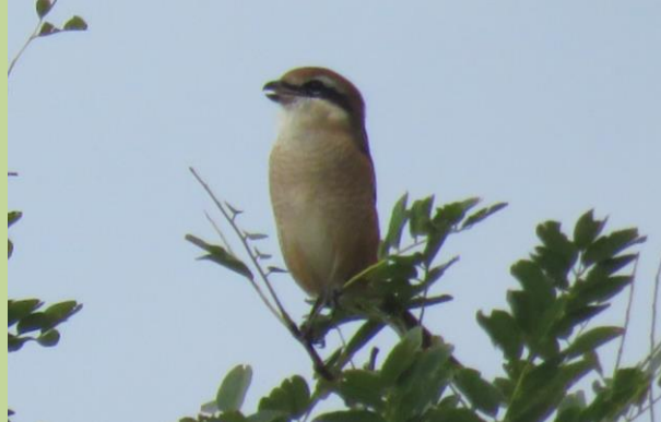
② モズが木のとっぺんにとまって、さかんに鳴いていました。「高鳴き」と呼ばれる冬のなわばり確保のための鳴き声です。