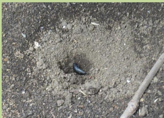
⑥ ウスバカゲロウの幼虫は、通りがかった小動物が巣穴の中へ落ちたところを大きなキバでかみつきます。