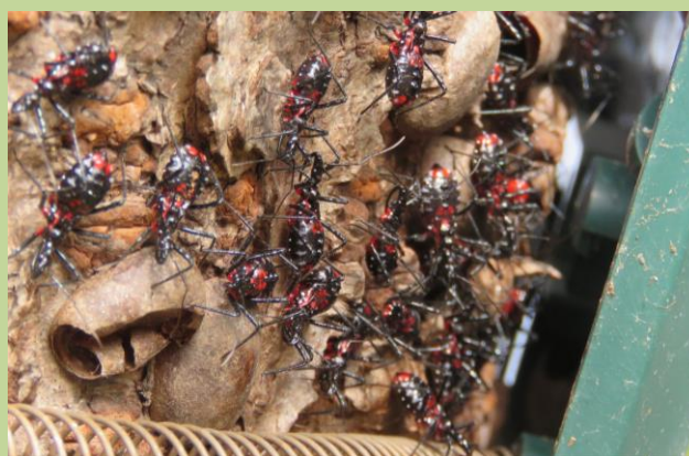
⑦ 遊歩道の樹木に設置された樹木名札をめくると、たくさんのヨコヅナサシガメの幼虫がかくれています。