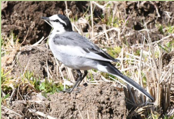
① ハクセキレイが鳴きながら飛来しました。尾が長く、地面をよく歩き回る鳥です。