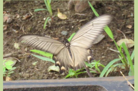
③ ジャコウアゲハの成虫（メス）が、博物館の横に植えてあるウマノスズクサに飛来しました。