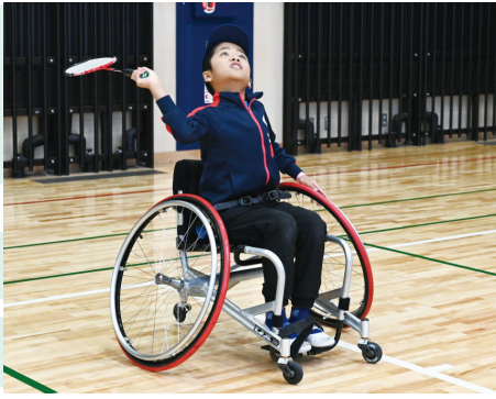
パラバドミントン