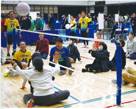
パラバレーボール(座位)