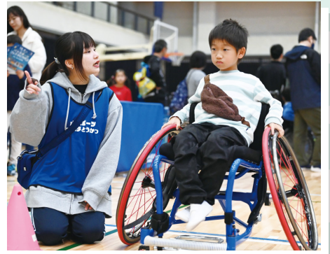
車いすスラローム