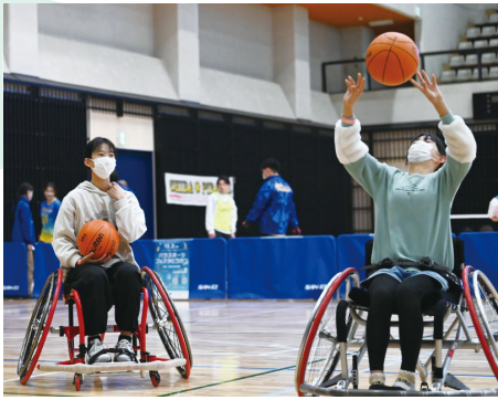
車いすバスケットボール