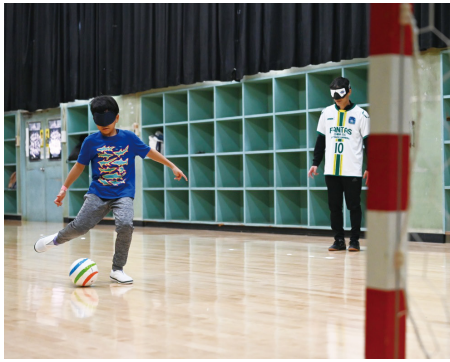
ブラインドサッカー