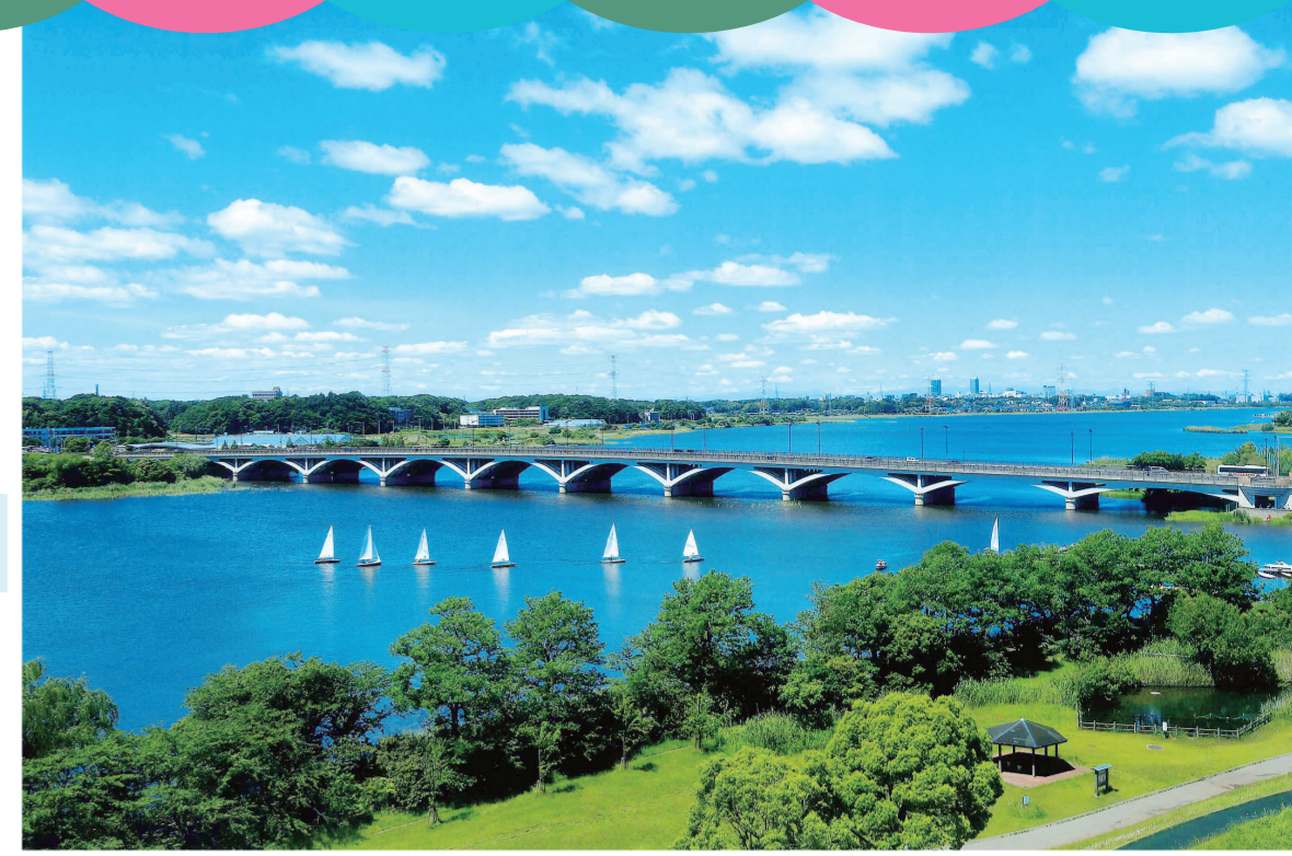
手賀大橋は、水鳥が羽を広げたデザインが特徴的。2024春放送されたドラマ「Believe-君にかけの橋-」のロケ地となりました

手賀沼リゾートとも称される、水と緑が豊かな千葉県我孫子市。その景観に魅せられて移り住んだ文化人も多く、歴史と文化のある街でもあります。近年は若い子育てファミリーも増加中、その理由を紹介します。