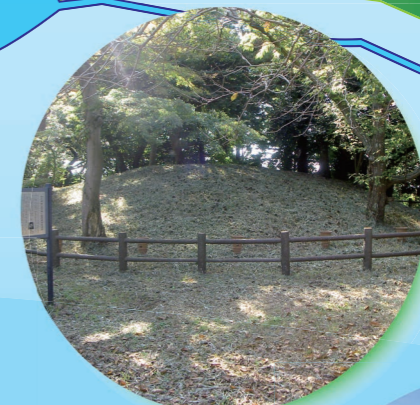
子ノ神5号墳（寿2丁目）