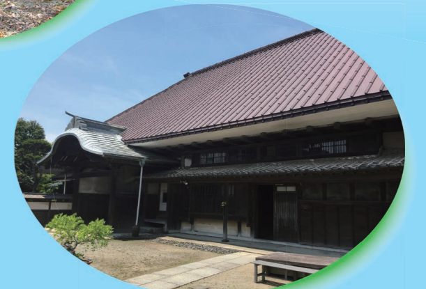
旧井上家住宅母屋（相島新田）