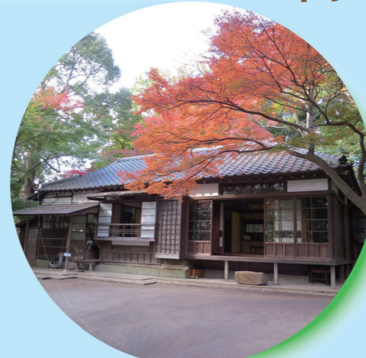
旧村川別荘母屋（寿2丁目）