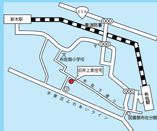
旧井上家住宅への経路