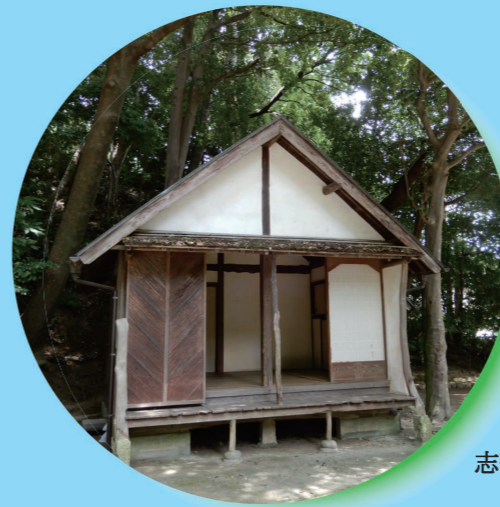
志賀直哉邸跡書斎（緑2丁目）