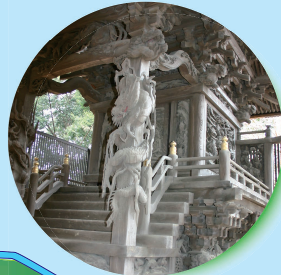
葺不合神社本殿（新木）