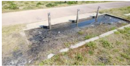
被飲水站炭扔掉的情況