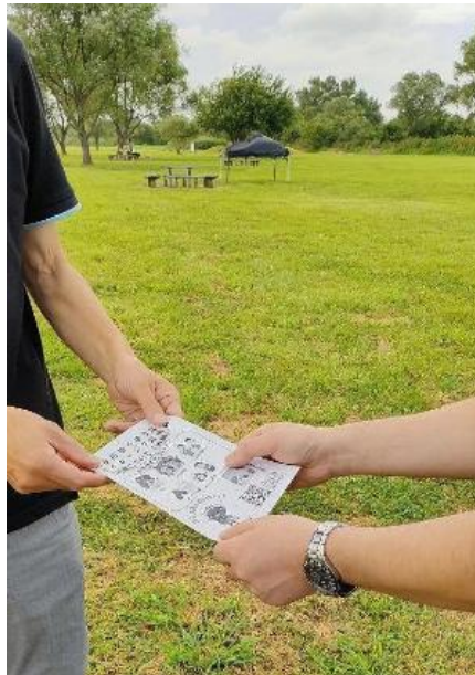
啟發傳單散發的情況