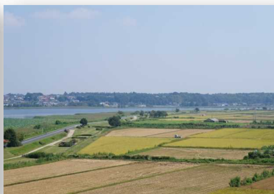
手賀沼周辺の田園風景