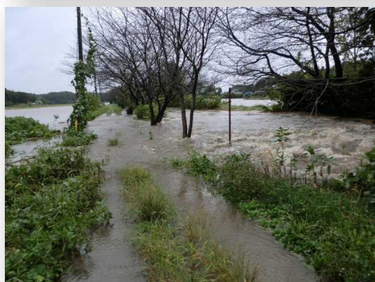
H25 台風 26 号時の金山落水路の状況