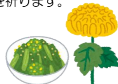
菊花酒、食用菊の料理

別名「菊の節句」。強い香りで邪気を祓うとされる菊の花を浮かべた菊花酒を飲み、長寿を祈ります。