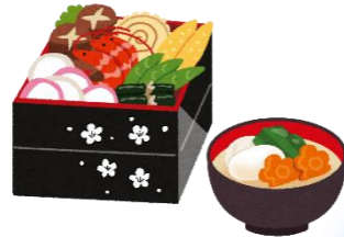
おせち料理、お雑煮

幸せや豊作をもたらす「歳神(としがみ)様」を各家庭で迎える行事として古くから大切に祝われてきました。おせち料理やお雑煮を用意して、一年の幸せを祈ります。