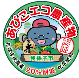
認証シールデザイン

現在、我孫子市ではあびこエコ農産物に貼ってある「あびこエコ農産物認証シール」(右参照)を20枚集めて応募すると、抽選でエコ農産物をプレゼントする「あびこエコ農産物応援キャンペーン」を開催中！この機会に、あびこエコ農産物をたくさん食べて、地元の農家さんを応援しながら、キャンペーンにも応募してみましょう！