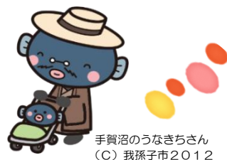
手賀沼のうなぎちゃん