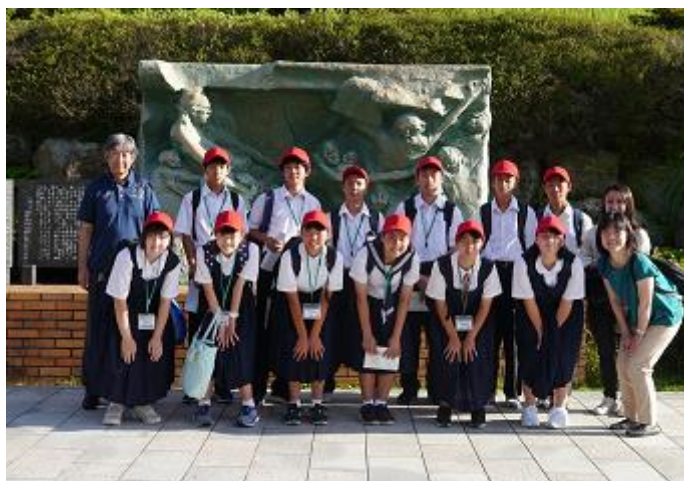
長崎市平和祈念式典中学生派遣事業の写真