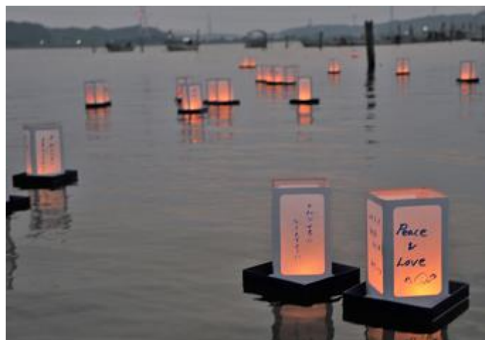
我孫子市平和事業 手賀沼とうろう流しの写真