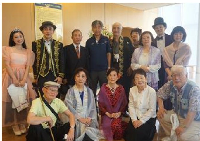
我孫子市民文化祭 あびこ舞台の皆さんとの写真