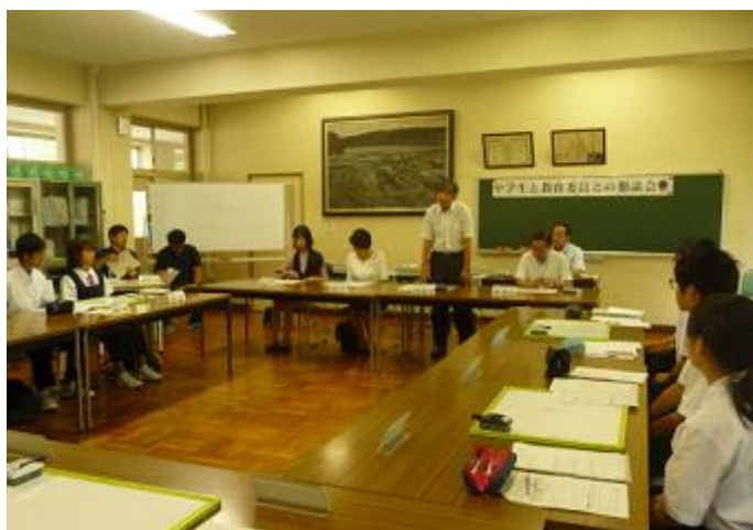
我孫子中学校 教育委員と中学生との懇談会の写真