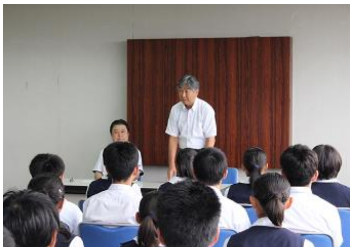
小中学生全国大会・関東大会出場者表敬訪問の写真