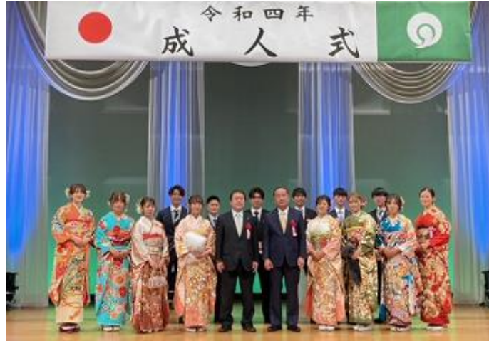
令和4年成人式の写真