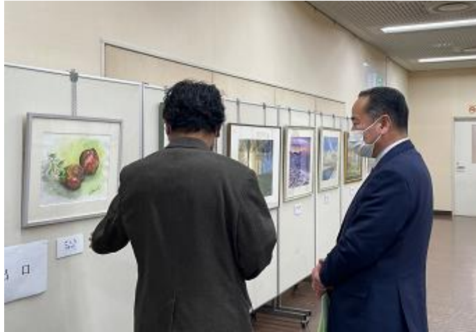
第12回山田きんしんと仲間たち展の写真その2