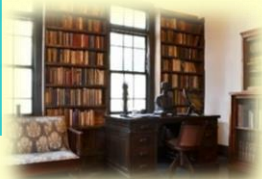
杉村楚人冠記念館