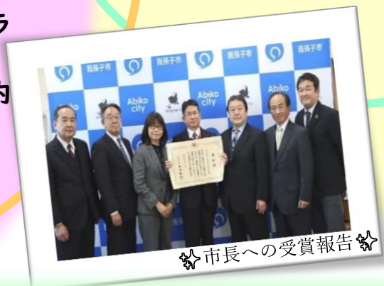
市長への受賞報告

学び舎コホミン誕生の経緯 「卒業生が社会に出ても学び続け、仲間づくりのできる居場所を作りたい」という思いから千葉県立湖北特別支援学校、我孫子市湖北地区公民館、川村学園女子大学の3者が連携し令和2年に「学び舎コホミン」が誕生しました。