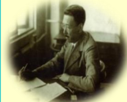
楚人冠執務中万年筆