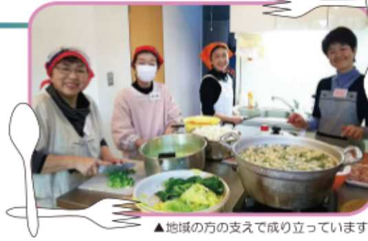
▲地域の方の支えで成り立っています