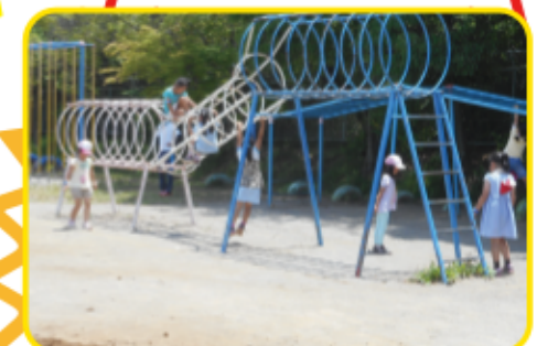
▲学校の校庭での外遊びの様子 【あびっ子クラブに関する問い合わせ】 我孫子市役所 子ども支援課 TEL: 04-7185-1492

市のスタッフと一体となって、放課後や土曜日などに子ども達と一緒に遊んだり、趣味や特技を活かして交流していただけるサポーターを募集しています。