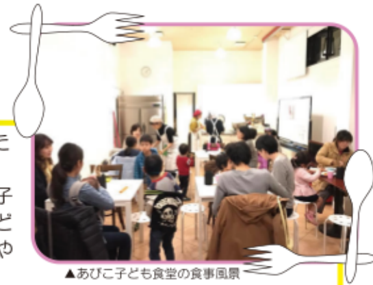
▲あびこ子ども食堂の食事風景

市内には下記の4カ所で開催されています。子どもだけではなく、大人も居場所が見つかる子ども食堂。色んな境遇や立場の人たちが同じテーブルを囲んで団らんすることで、地域の居場所、新たな繋がりが生まれる場となっています。