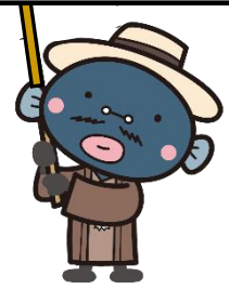
我孫子市マスコットキャラクター 手賀沼のうなきちさん

普段から自治会・町内会の活動を通して地域住民同士が交流することで、住民同士の信頼関係や新たな交流が生まれ、災害など有事の際には、互いに助け合いやすくなる等、地域の住民が安心できる快適なまちづくりをめざして活動しています。