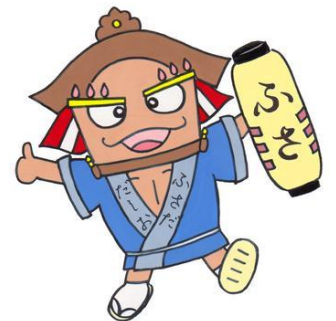
布佐地区キャラクター ふさだ だしお