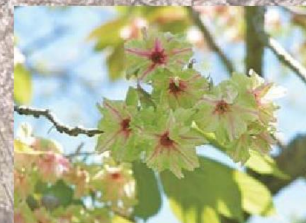
御衣黄(ギョイコウ)

普賢菩薩が乗る白象に見立ててこの名がついたとされる。花の咲く時期は‘染井吉野’より遅い。大輪、八重咲き。