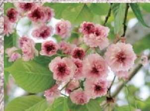
梅屋敷数珠掛桜(バイゴジユスカケザクラ)

花の咲く時期は‘染井吉野’より遅い。大輪で、八重咲き。花色は淡紅色で花の中心部に近いほど白く、花弁の先端には細かな切れ込みがある。