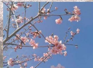
河津桜(カワツザクラ)

花の咲く時期は‘染井吉野’より遅い。花色は淡紅色で、中心部の色は濃く、花弁の間から多数のおしべがのぞく。