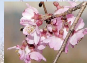
糸桜(イトザクラ) / 別名 枝垂桜(シダレザクラ)

花の咲く時期は‘染井吉野’より遅い。新葉は黄緑色で、花よりやや遅れて展開する。大輪で、花色は紅色。八重咲きの花が、手毬状につく。