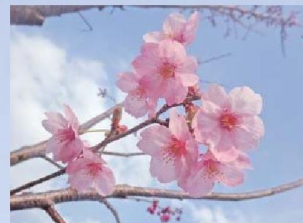
陽光桜(ヨウコウザクラ)

‘染井吉野’とほぼ同時期に開花し、花と同時に緑色の新葉が出る。大輪で、花色は白色、一重咲きで、花には芳香がある。