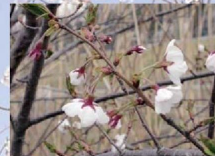
越の彼岸桜(コシノヒガンザクラ)

花の咲く時期は‘染井吉野’より遅いが、八重咲きのサクラの中では比較的開花期が早く他の八重咲き品種に先がけて咲く。大輪で、八重咲き。