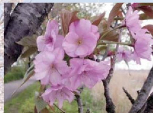
御車返し(ミクルマカエシ)

花の咲く時期は‘染井吉野’より遅い。大輪で、八重咲き。花色は紅色。花色が濃く花びらの枚数が多いので、塩漬けのサクラの材料として利用される。