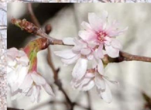
十月桜(ジュウガツザクラ)

‘染井吉野’よりやや早い時期に開花する。花は小輪、一重咲き。福島県三春町の「三春滝桜」は日本最大の‘枝垂桜’として有名。