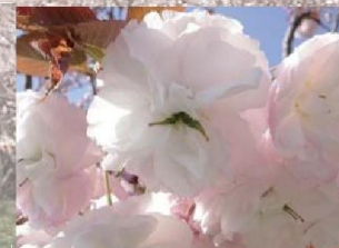
普賢象(フゲンゾウ)

花色が濃く、一重咲き。花期はソメイヨシノより早い。花期が長い。静岡県賀茂郡河津町が名前の由来。