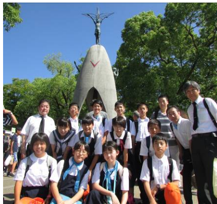
▲原爆の子の像前にて