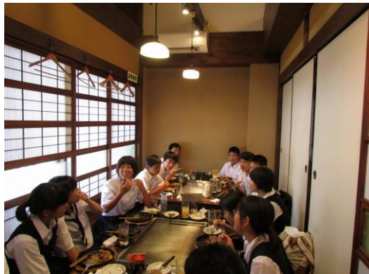
▲昼食は広島流お好み焼き