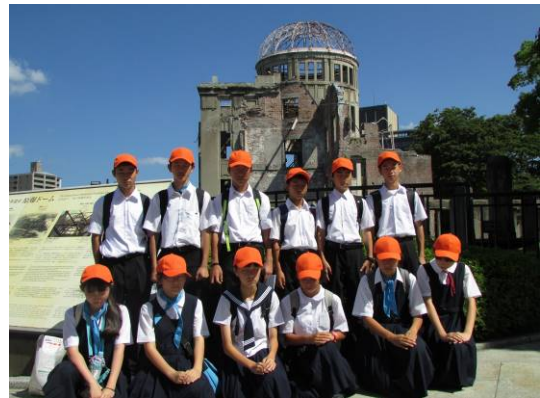
▲原爆ドーム前にて