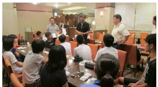
▲市長、教育長から翌日に向けたアドバイス