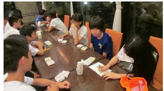
▲8月5日事業の班ごとに1日の振り返りと反省点を確認