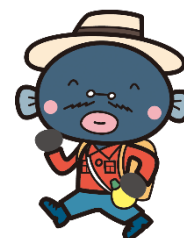
我孫子市マスコットキャラクター 手賀沼のうなきちさん