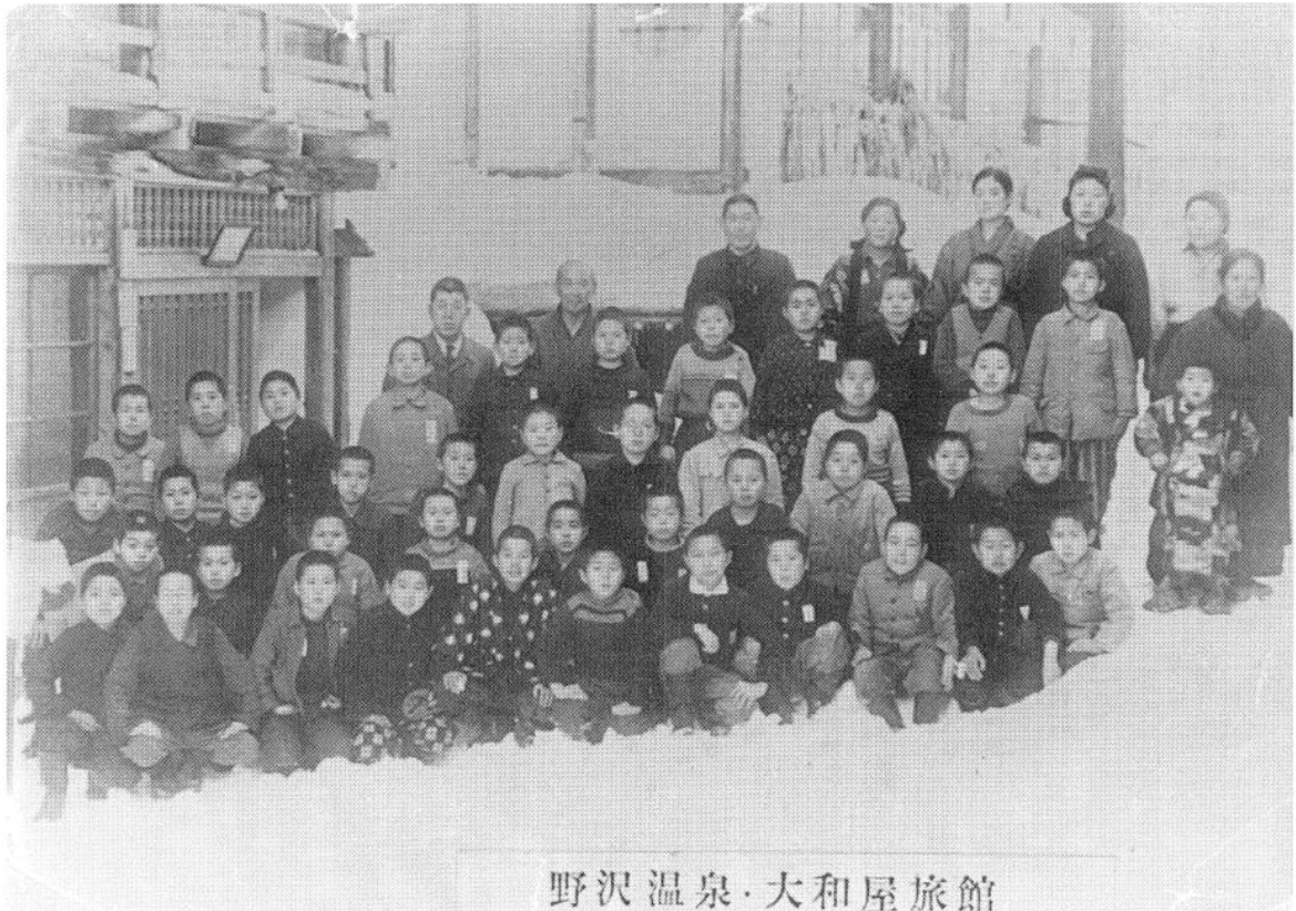
(上) 昭和19年 大和屋旅館にて