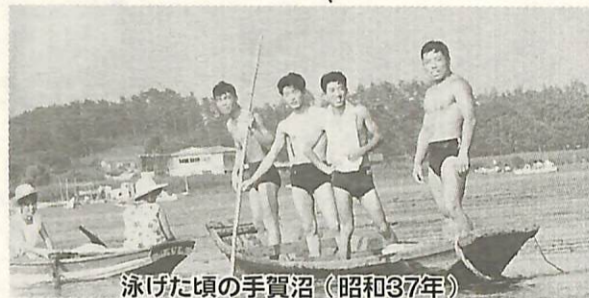
泳げた頃の手賀沼(昭和37年)