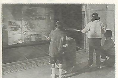
▲映像の火災に放水しての消火訓練

現在市内には、62の自主防災組織が設立されており(組織率38.3%)、初期消火や救済活動に貢献しています。また、自主防災組織の設立を、ぜひご検討ください。 ▼資器材を交付する組織数 年間先着10組織 ▼主な交付資器材(50万円相当) ヘルメット、腕章、拡声器、テント、担架、消火器、救助工具、発電機、救急応急処置セット、簡易倉庫など ※組織作り等について、詳しくは地域振興防災課防災係(85)1111内線217へ