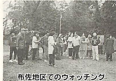
布佐地区でのウォッチング

▼応募資格 どなたでも(市外在住の方も応募できます) ▼応募規定 ①作品は未発表のものに限り1人5点まで②作品は原則として返却しませんが③作品に応募票(都市計画課に用意)を添付すること④作品の第一使用权は主催者に帰属します ▼応募先・問い合わせ 〒270-1192 我孫子市役所都市計画課景観推進係(85)1111内線577