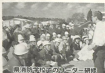
県消防学校でのリーダー研修

市では災害時に、地域で避難、救護、初期消火活動ができるよう「自主防災組織」づくりを積極的に進めています。大規模な災害が起こった場合に、ご近所同士が協力し合