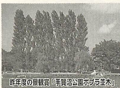
昨年度の景観賞「手賀沼公園ポプラ並木」

我孫子市景観賞は昨年度に創設され、第1回は手賀沼公園ポプラ並木、上新木字吾妻の屋敷まわりの高垣が景観賞に、布佐平和住宅地区が景観奨励賞に選ばれました。今回、第2回の景観賞を募集します。 あなたの周りに、風景をひきたせている建物はありませんか。また、景観をよくし