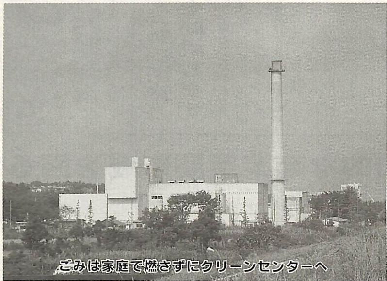
ごみは家庭で燃さずクリーンセンターへ

近年、ダイオキシンの発生が大きな社会問題になり、市民の皆さんにとって大きな心配事の一つです。ダイオキシンは食物などを通じて私たちの体に入り健康に影響を及ぼす物質といわれ、排出量の削減が急務となっています。今号では、ダイオキシンの基礎知識と市の現状などをお知らせします。