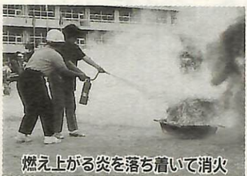
燃え上がる炎を落着いて消火

9月5日、総合防災訓練が我孫子中学校と我孫子第三小学校を会場として行われました。 今回は、天王台地域を対象に、地域内の自治会や婦人防火クラブなど総勢2400人が参加。午前8時30分に震度7の地震が発生し、家屋の倒壊、火災が多発したとの想定で訓練を開始。 はしご車を使った高所からの救出訓練や電力会社の電力復旧訓練、消防団の送水消火訓練など各会場に避難した人が見守る中、行われました。 起震車での地震体験やバケツリレーの消火訓練は、地域の方も参加し、とても真剣な表情。第三小学校では消火器を使う訓練に小学生も参加。最初は吹き出す音にびっくりしたけど、あとは平気だったよ、と頼もしい感想でした。