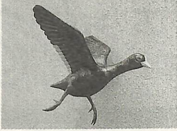
▶寿商店会の街路灯を飾る市の鳥オオバン