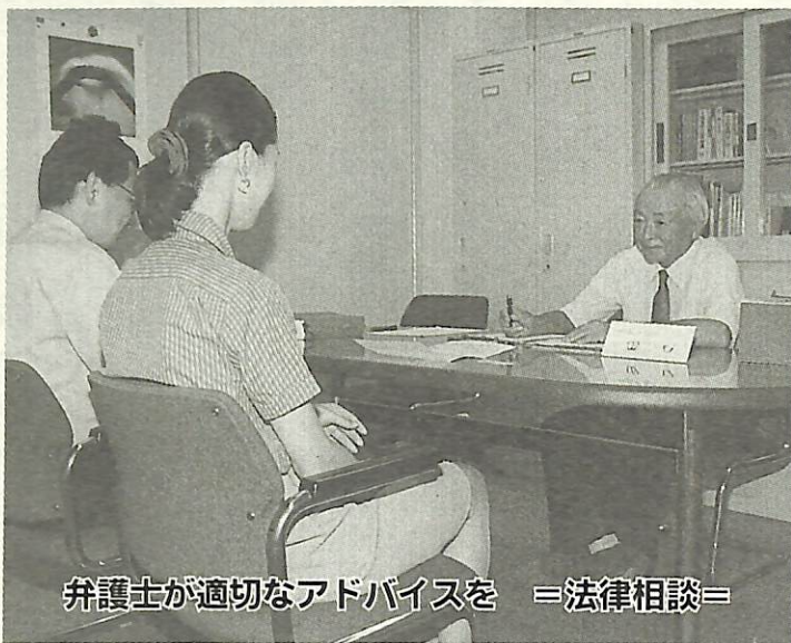
弁護士が適切なアドバイスを = 法律相談 =

相続が発生したが、法的な手続きがよくわからない、お金の貸し借りでトラブルが生じた等、民事問題などでお悩みの方は法律相談をご利用ください。 市で委託した弁護士が、専門家の立場から適切なアドバイスをします。(予約制) ▼相談日 おおむね毎週火曜日と毎月第1・3木曜日(その月によって変動がありますので、広報あびこ各月1日号最終面で確認ください) ▼場所 市役所西別館3階市