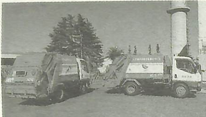
「オオパシ」と「ウグイス」のマークがLPG車

LPG（プロパンガス）を燃料とする塵芥収集車が、7月下旬クリーンセンターに2台導入されました。 LPG車は、ディーゼル車のような黒煙の排出がなく、大気を汚染し健康に影響があるとされるNOX（窒素酸化物）や、PM（粒子状物質）を低く抑えることができます。 また、エンジン音が比較的静かなことから、住宅地などでの騒音防止にもつながります。 クリーンセンターでは、人や環境にやさしい低公害車に、今後も随時切りかえていく予定です。 ▼問い合わせ クリーンセンター ☎(87)0015