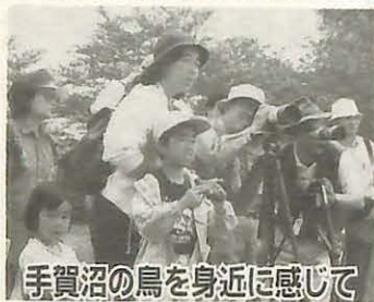
手賀沼の鳥を身近に感じて

手賀沼のほとりで見たり、音楽を聞いたり、絵を描いたり、手賀沼にふれる感覚を感じてほしい。『ENJOY手賀沼』は、一人ひとりに手賀沼のかわらぬ魅力を伝えるため、今年、13団体で実行委員会を作り、さまざまな催しを用意しました。ぜひお立ち寄りください。