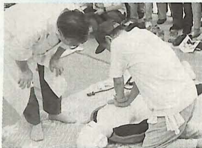
▲医師の指導を受けて人工呼吸の訓練