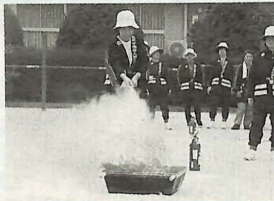
▲消火器を使った初期消火訓練