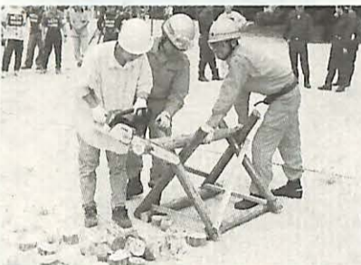
▲チェーンソーで木材を切断