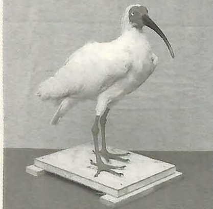
修復されたトキのはく製