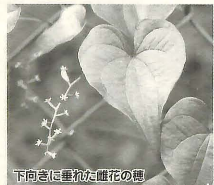
下向きに垂れた雌花の穂

期間 9月9日(土)から11月5日(日) 問い合わせ 市民プラザ ☎(83)2111