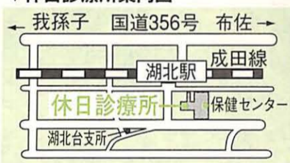
▼休日診療所案内図

年末は12月31日まで。年始は1月4日から。ただし、12月31日、1月3日の通夜の使用はできません。