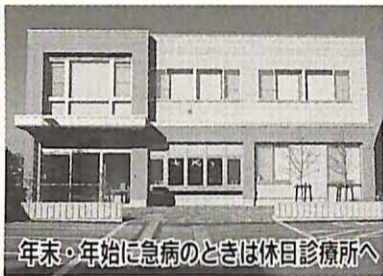
年末・年始に急病のときは休日診療所へ