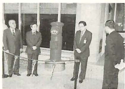
局長らが出席。(写真)

我孫子郵便局から、円筒型のポスト（郵便差出箱1号丸型）が寄贈され、市役所本庁の正面玄関脇に設置されました。