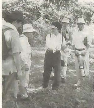
▼育成講座の日程と内容