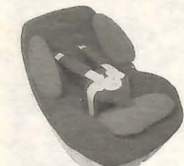
お子さんにはチャイルドシートを

「のみません しめすべし」と「気のゆるみ」をスロルトと、交通事故防止運動1ガンに、交通事故防止運動が、来年1月3日まで実施されています。 市内でも、これまでに2名の方が亡くなっています。警察では、犠牲者を一人でも減らすため、交通取り締まりを強化していますが、皆さんも交通ルールとマナーを守り、次のことに気を付けて安全運転を心がけましょう。 ◎重点目標 *シートベルトとチャイルドシート着用の徹底 *高齢者の交通事故防止 *夜間の交通事故防止 *飲酒運転と無謀運転の追放 問い合わせ 交通整備課(85)1111内線330