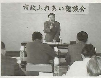
市政ふれあい懇談会