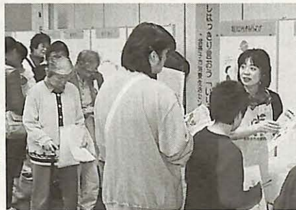
▶ 昨年の消費生活展の様子

今年の消費生活展は、「循環型社会をめざして」をメインテーマとして開催します。 「環境のことを考えて暮らしていますか」と題し、循環型社会実現のための取り組みのパネル展示、イースの張り替えや牛乳パックとストローで竹トンボを作る実演などを行います。 お友達やご家族と一緒に、ぜひご来場ください。