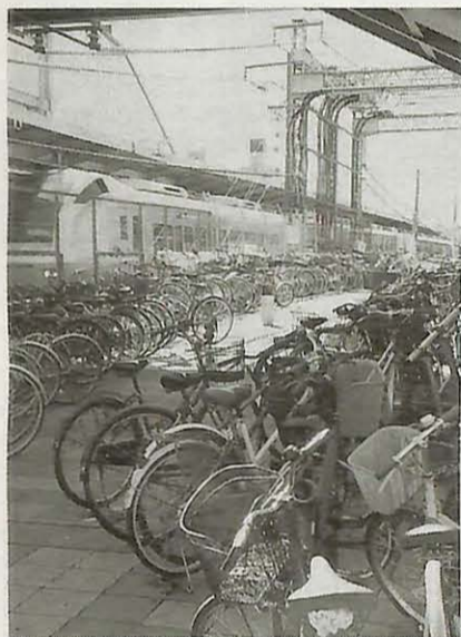
▲放置自転車はみんなの迷惑 (我孫子駅北口で)

市では、10月1日(月)から11月30日(金)まで「困ります 自転車置き去り知らんぷり」を合言葉に、「駅前放置自転車クリーンキャンペーン」を行います。駅前の道路や歩道に放置された自転車は、高齢者や身体の不自由な方の通行を妨げるばかりか、災害の際には避難や救助の障害にもなりかねません。「チヨットだけだから大丈夫」といった軽い気持ちで、多くの放置