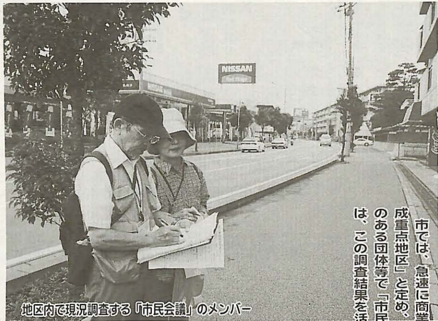
地区内で現況調査する「市民会議」のメンバー

市では、急速に商業開発が進んでいる若松や我孫子新田周辺を「手賀沼景観形成重点地区」と定め、今年8月から地区住民や公募の市民、まちづくりに関心のある団体等で「市民会議」を組織し、同地区の現況調査を開始しました。今後は、この調査結果を活かして景観の改善に取り組みます。