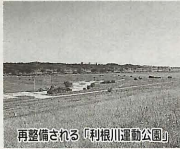
再整備される「利根川運動公園」

来年4月に開館する生涯学習センターの我孫子地区公民館学習室の利用方法について、説明会を行います。 日時・場所 11月29日(木)午後2時、市民プラザ 内容 学習室の利用時間・使用料、申し込み・使用料支払い方法など 問い合わせ 湖北地区公民館 ☎(88)4433