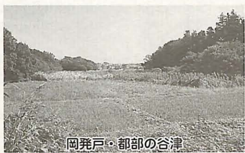
岡発戸・都部の谷津

最近、季節を感じる環境が少 なくなっています。そこで、市 内でも数少なくなった谷津を歩 き、自然とふれあいながら、秋 の深まりを探してみませんか。