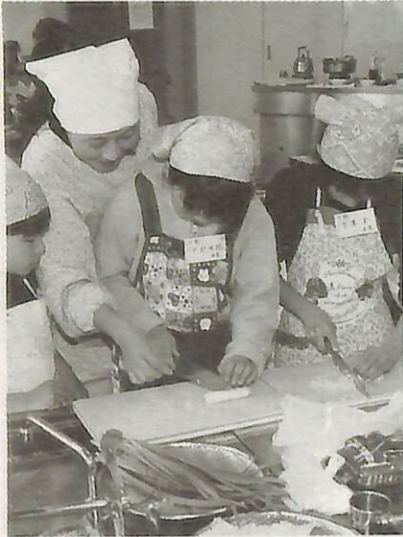
「子どもクッキング」で餃子作りに挑戦 (アピスタで)