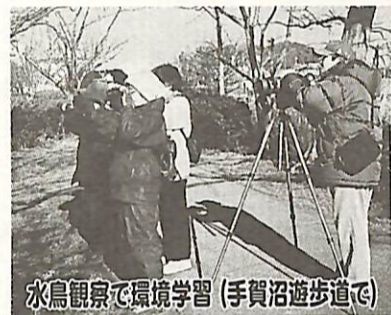
水鳥観察で環境学習(手賀沼遊歩道で)

これまで市役所の各課で別々に行ってきた学習事業を、すべて「あびこ楽校」の事業として