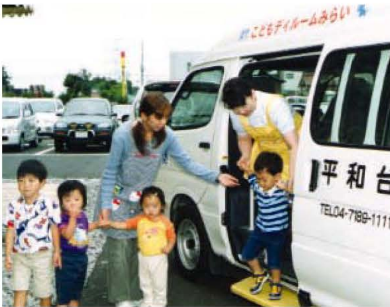
▲バスに同乗した看護師から病児保育所の保育士へ

病児保育所「こどもデイルームみらい」は、病児回復期にまだまだ安静が必要で、一般の保育園での集団保育が困難なお子さんを、一時的にお預かりする保育所です。昨年2月から、市が平和台病院に委託して開設していますが、より利用しやすくするため、8月1日からバスを利用した「お出迎えサービス」を始めます。