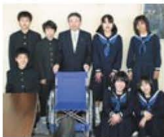
▲贈った車イスを囲んで

目標が達成できた充実感でいっぱい 湖北中学校2年4組、廃品回収の収益で市に車イスを寄贈 という意志を引き継ぎ、活動を開始。校内や地域の商店にも呼びかけ、アルミ缶や新聞紙、段ボールなどを集めて回り、その姿を見た保護者の協力も得て、昨年を上回る収益となりました。クラスを代表して市役所を訪れた7人(写真)は「回収先で倉庫に入ったとき大量の虫が出てきて怖かったり、回収した新聞紙をトラックに積むときに重くて大変だったけれど、目標が達成できた充実感でいっぱい」と語りました。 市に寄贈された車イスは貸し出し用として利用されます。