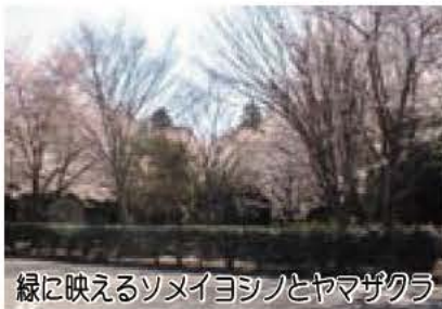
緑に映えるソメイヨシノとヤマザクラ

菜の花がそろそろ見頃 市(財)あゆみの郷公社では、手賀沼沿いの美化とにぎわいづくりのため、土地所有者と共同で約5000㎡の土地に菜の花を栽培しています。この菜の花は、3月中旬ころが見ごろになりそうです。 開花期間の土・日曜日には、イベントを開催する予定です。菜の花や食用ナバナの摘み取り(有料)、餅つきと販売、新鮮野菜の販売、菜の花畑でのミニSLの運行(有料)などを予定しています。