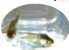
▲放流したサケの稚魚