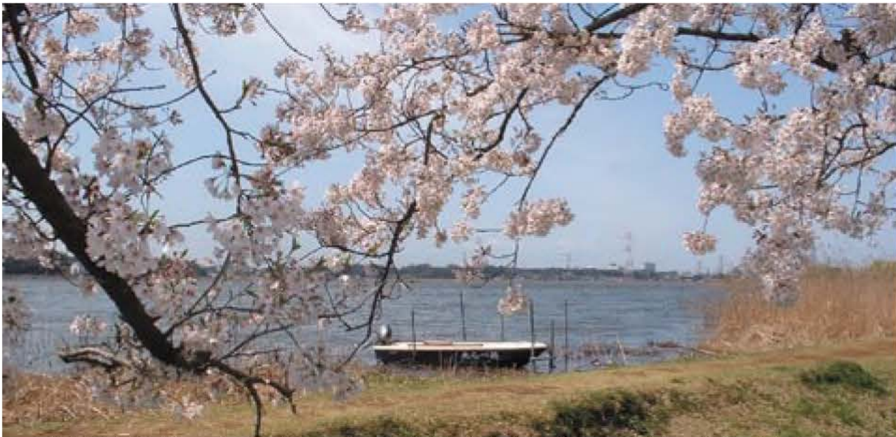
▲手賀沼遊歩道(約5km)には約400本の桜が咲き誇ります(昨年4月上旬に若松で撮影)