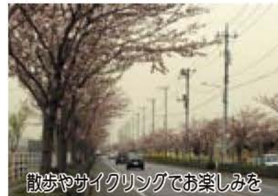
散歩やサイクリングでお楽しみを