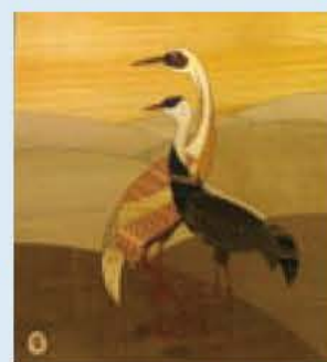
▲20種類の木を使った作品「ナベツルとマナツル」