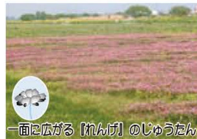
一面に広がる「れんげ」のじゅうたん