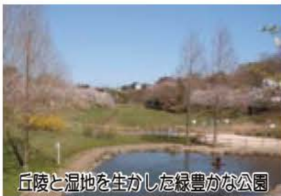
丘陵と湿地を生かした緑豊かな公園