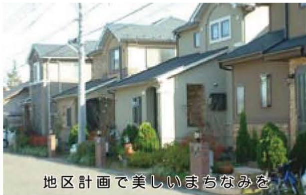
地区計画で美しいまちなみを

現在5つの地区が制度を利用している。市内では、地区計画制度を利用したまちづくりが現在5つの地区で進められています。つくし野北、つくし野西、つくし野5丁目、新木駅南側、高野山宮