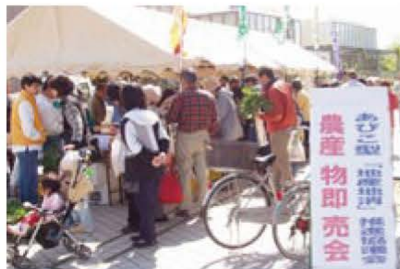
アピスタ前での定期即売会

市では、「あびこエコ農産物」の育成、定期即売会などを進めながら、今年度には公設民営の農産物直売所の基本計画を作ります。