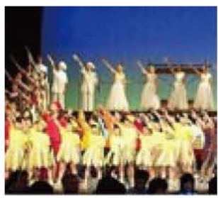
▲あの感動をもう一度

来年8月に上演を予定しているあびこ市民ミュージカル「ハムレット」の出演者オーディションを行います。 この作品は「ロミオとジュリエット」をもとに、全32曲の音楽で構成されるオリジナルミュージカルで、小学生から高齢の方まで出演できます。 詳しくは、募集要項(市役所、