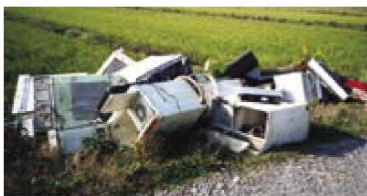
▲後を絶たない不法投棄

もし、不法投棄を発見した場合は、クリーンセンターへお知らせください。 私たちのまちを清潔で快適な環境にするため、皆さん一人ひとりのご協力をお願いします。 ◎ クリーンセンター ☎7185・0015